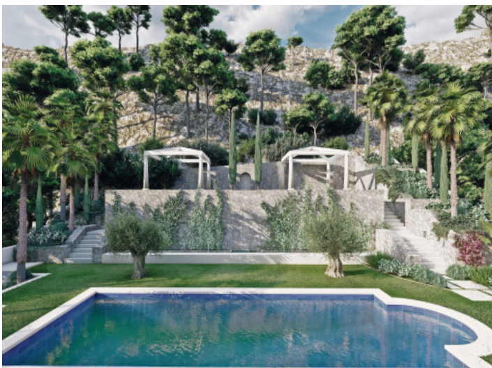
Garten und Poolbereich