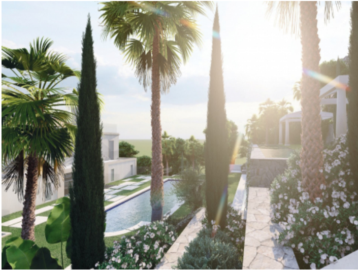
Mediterraner Garten mit Pool