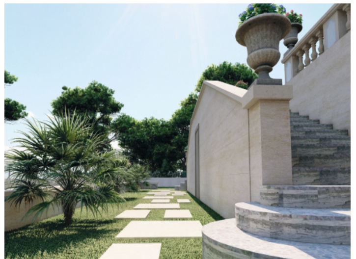
Ansicht des Gartens