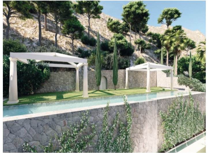
Blick auf den Pool