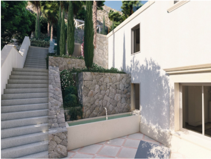
Ansicht des Gartens