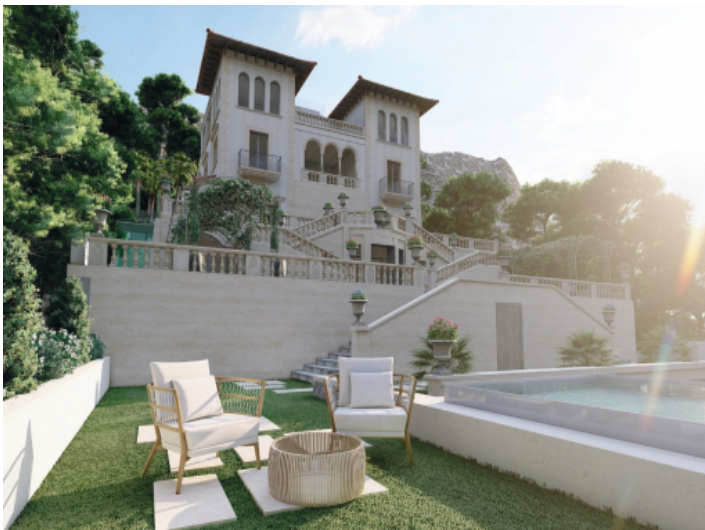
Außenansicht und Poolbereich