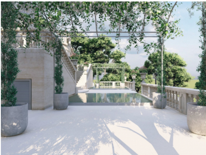
Blick auf den Pool