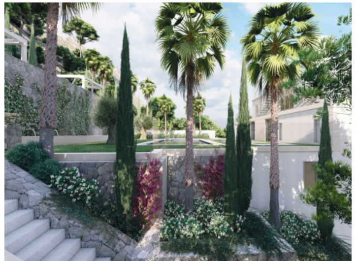
Garten und Poolbereich