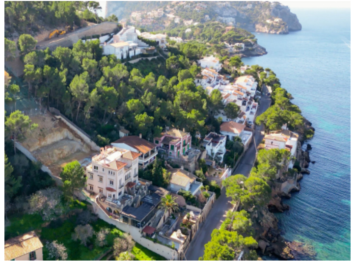
Das Grundstück liegt direkt am Meer