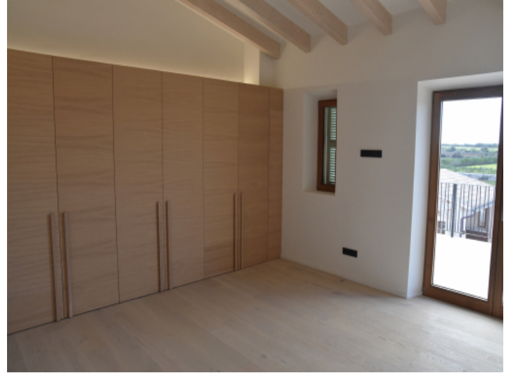
Schlafzimmer mit Kleiderschrank