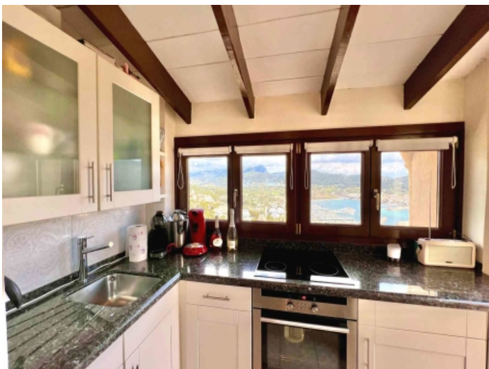
Küche mit Ausblick