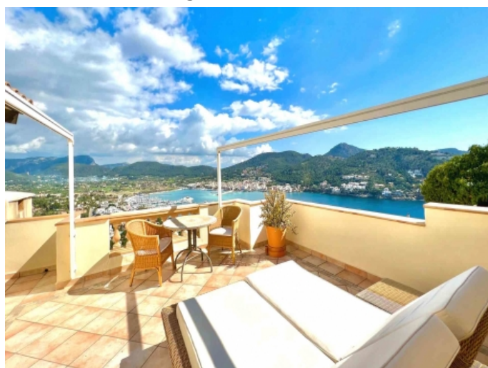
Dachterasse mit Weitblick