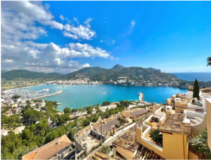
Blick auf den Hafen Port Andratx