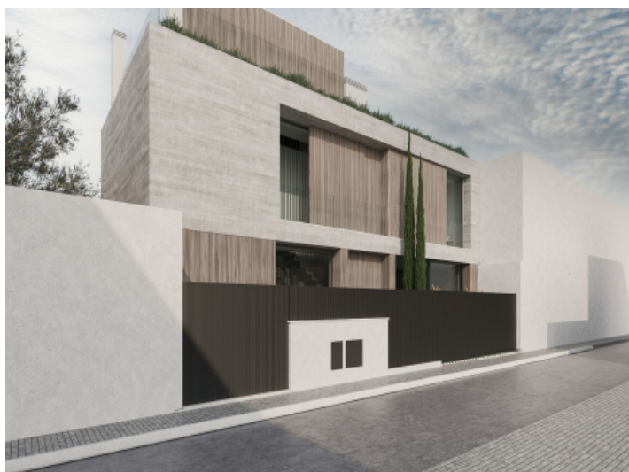
Blick von der Straße