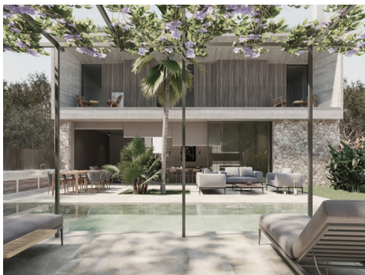
Außenbereich und Pool