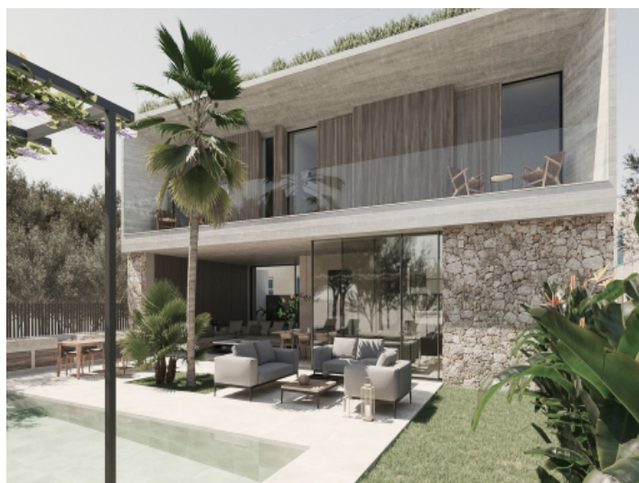
Außenbereich und Pool