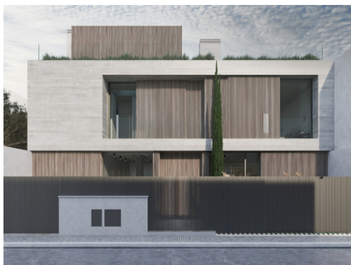
Blick von der Straße