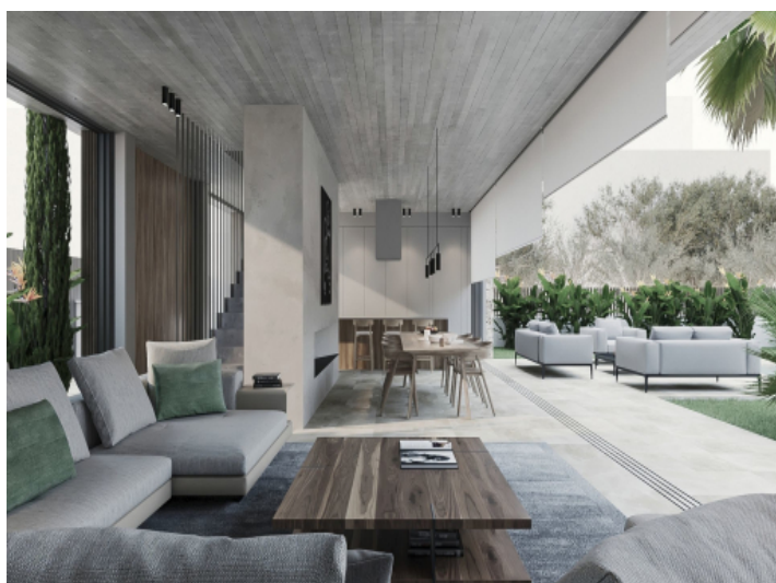
Wohnbereich und Terrasse