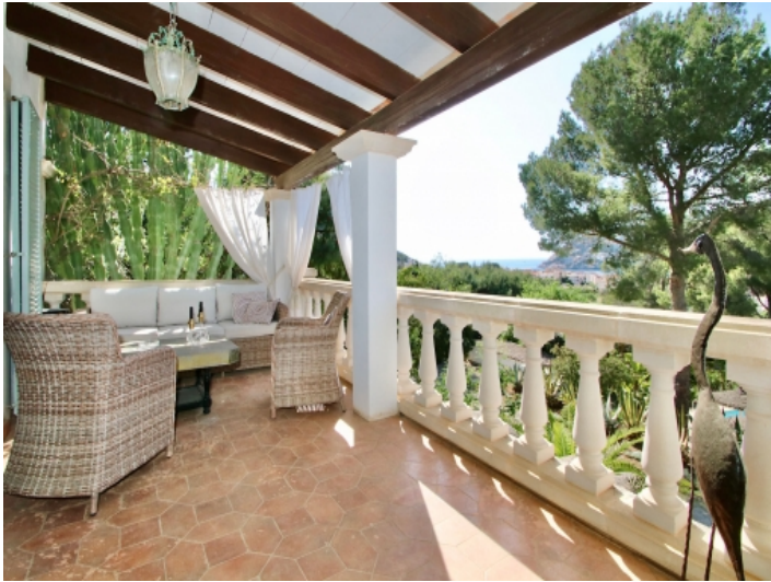
Überdachter Balkon mit Sitzbereich