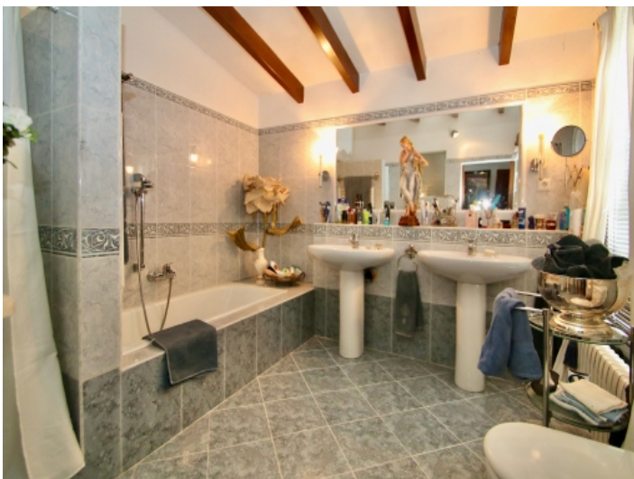
Badezimmer en Suite mit Badewanne