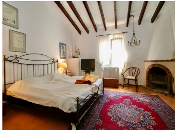
Hauptschlafzimmer mit Badezimmer en Suite