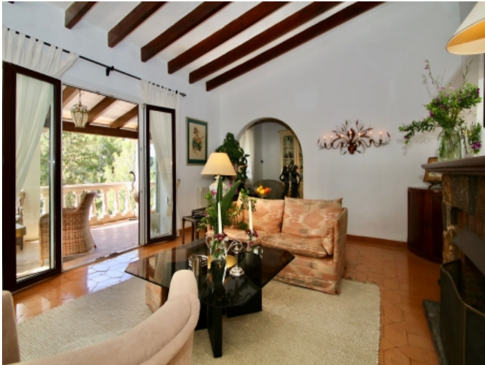
Heller Wohnbereich mit Holzbalken