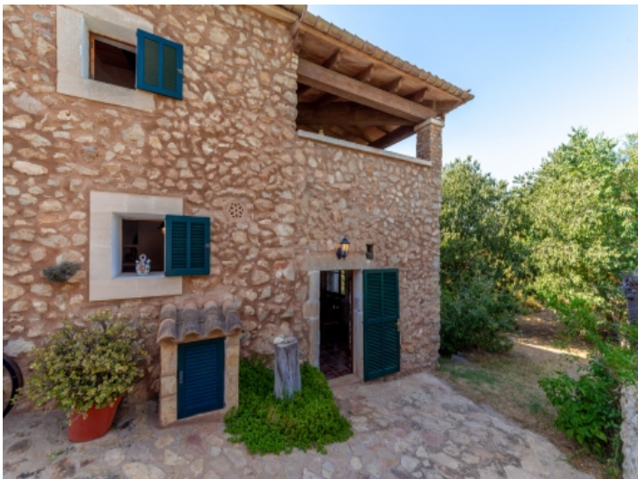
Außenansicht der Finca