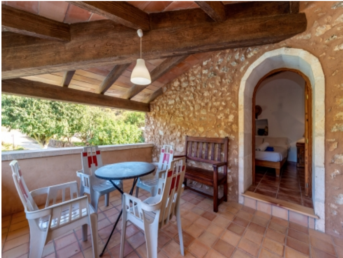
Terrasse mit Sitzecke