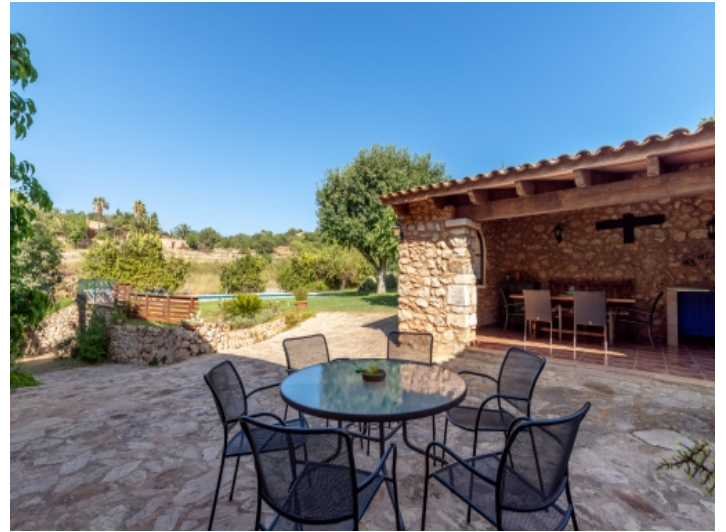
Blick zum Poolbereich