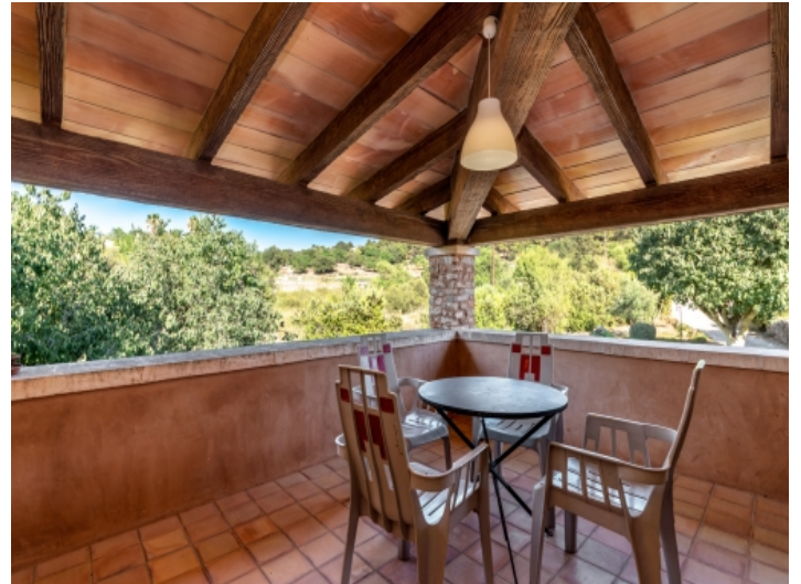
Terrasse mit Sitzecke