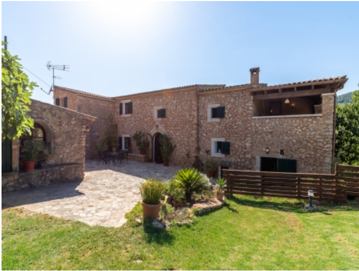
Außenansicht der Finca