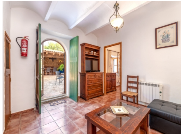
Eingangs- und Wohnbereich