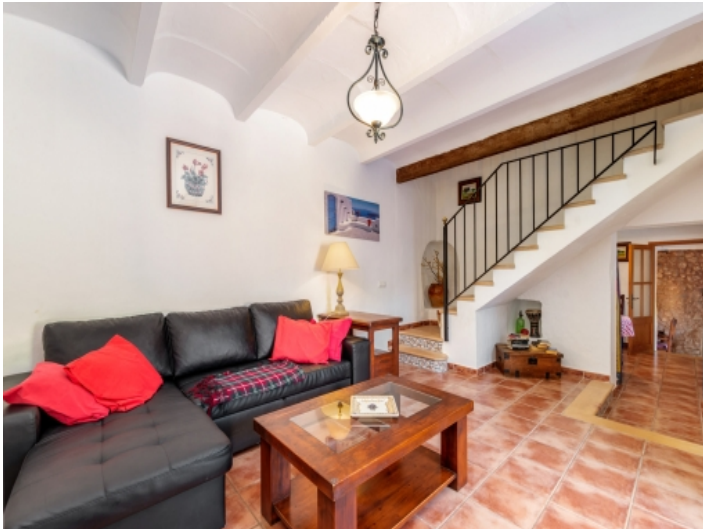
Gemütlicher Wohnbereich Blick zur Küche