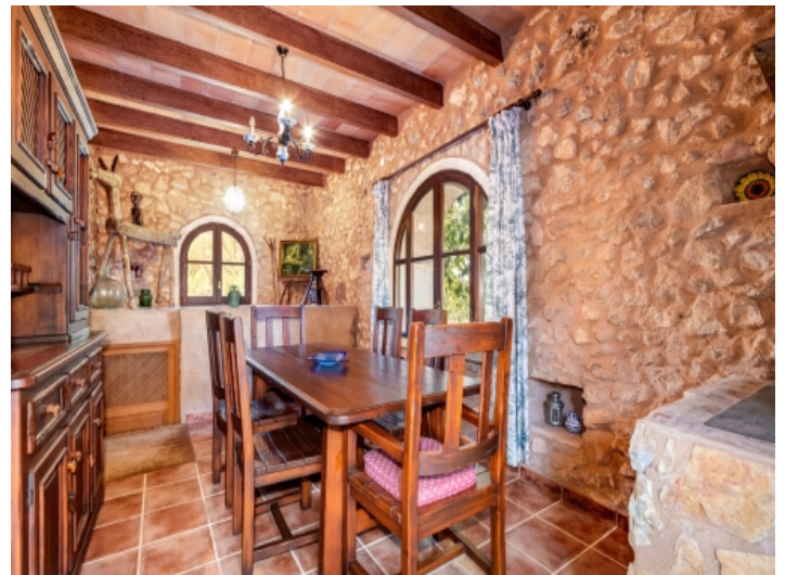
Essbereich mit Natursteinfassade