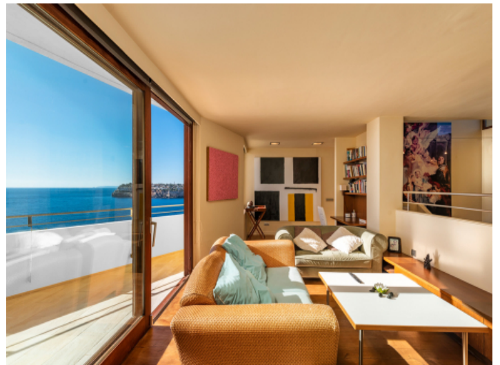
Oberer Wohnbereich mit Meerblick