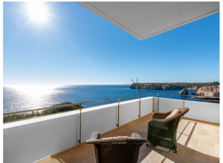
Balkon des Hauptschlafzimmers