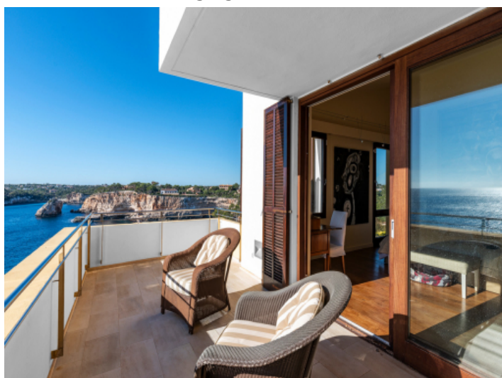
Privater Balkon des Hauptschlafzimmers