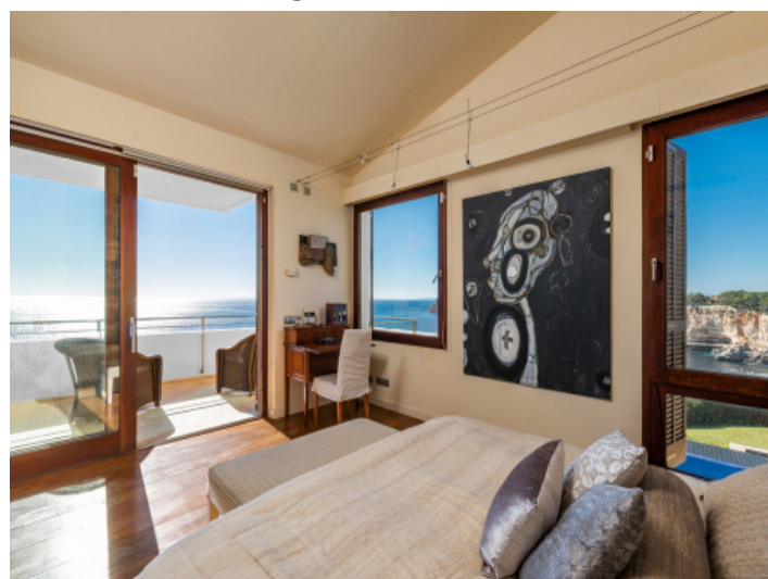
Hauptschlafzimmer mit Badezimmer en Suite