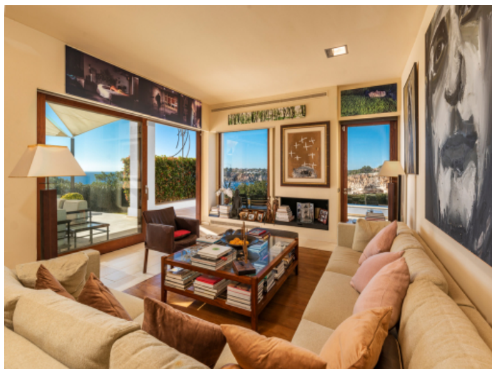
Zugang zur Terrasse