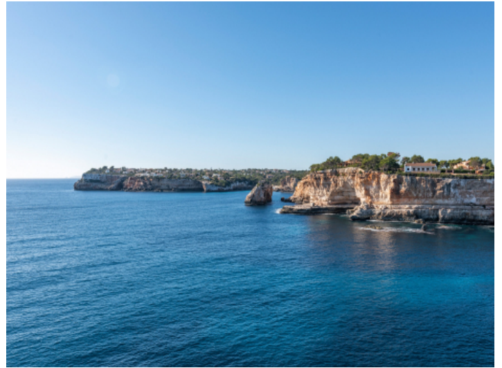
Ansicht der Umgebung