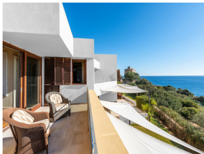
Alternative Ansicht des Balkons