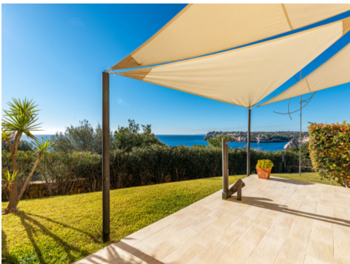
Großer Garten mit Terrassen