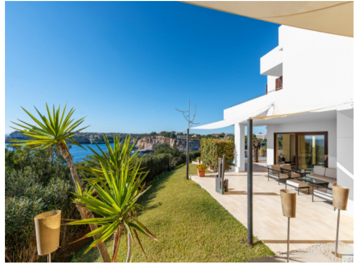
Ansicht des Gartens mit Terrasse