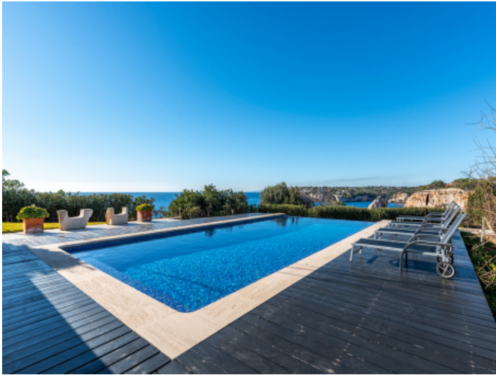
Poolbereich mit Sonnenliegen