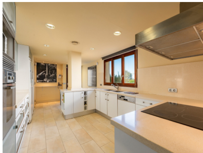
Voll ausgestattete Küche in weiß