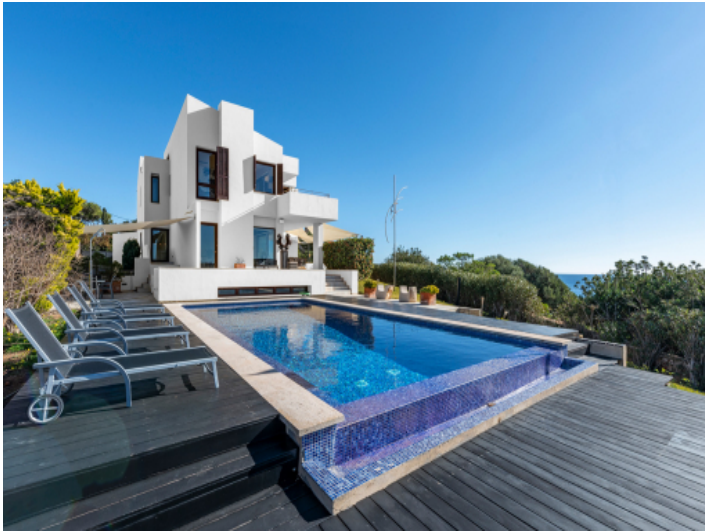
Außenansicht und Poolbereich