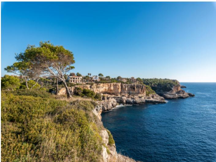
Ansicht der Umgebung