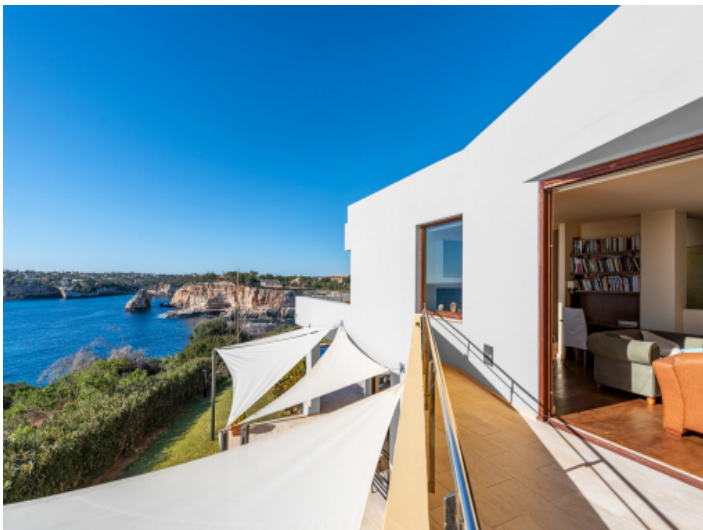
Balkon des oberen Wohnbereichs