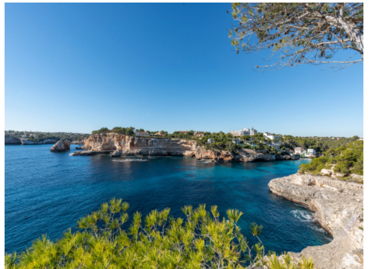
Ansicht der Umgebung