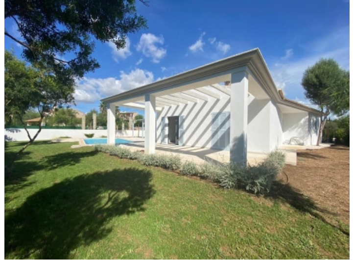
Außenansicht und Garten