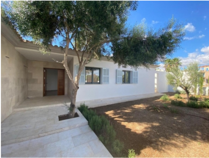
Eingangsbereich der Villa