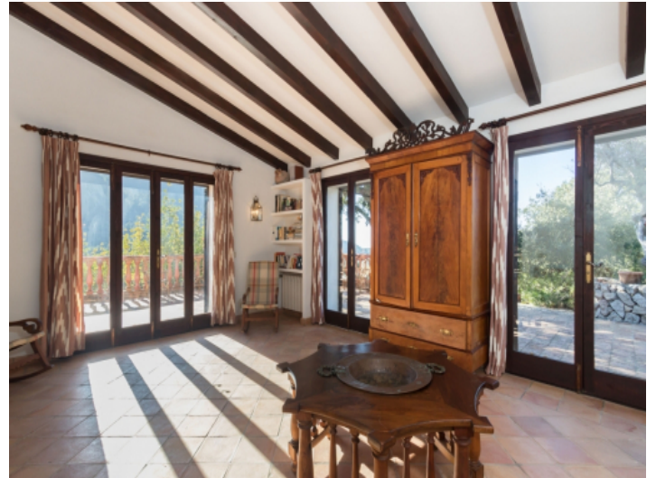
Großzügiger Wohnbereich mit Zugang zur Terrasse