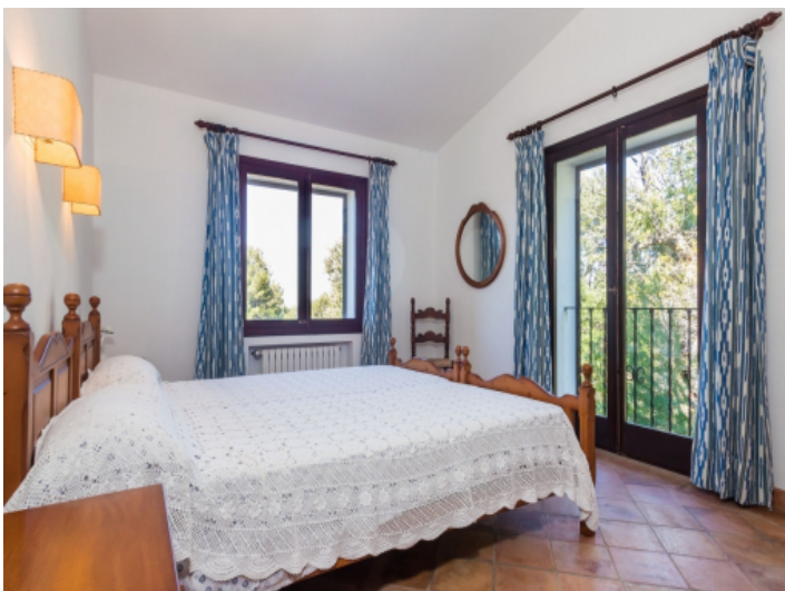
Die Finca verfügt über 4 Doppelschlafzimmer