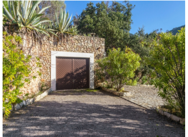
Garage auf dem mediterranen Grundstück