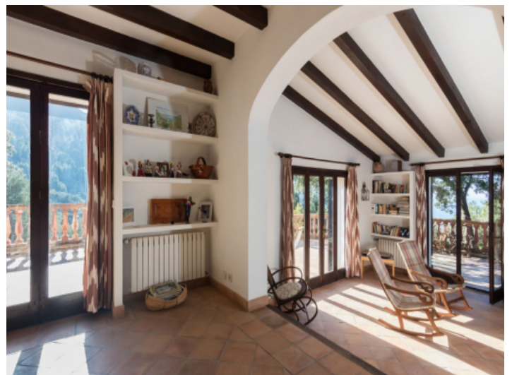
Das Haus hat einen sehr typischen Character