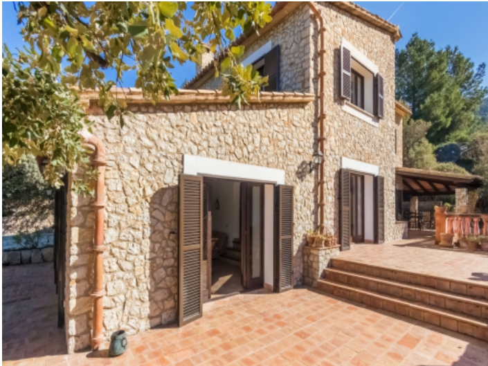
Eine fantastische Terrasse umgibt die Finca