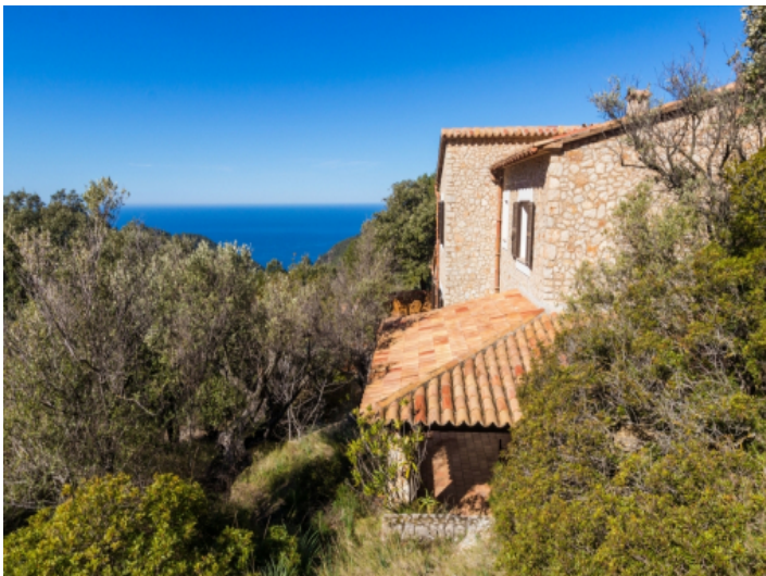
Die Finca bietet einen wundervollen Meerblick