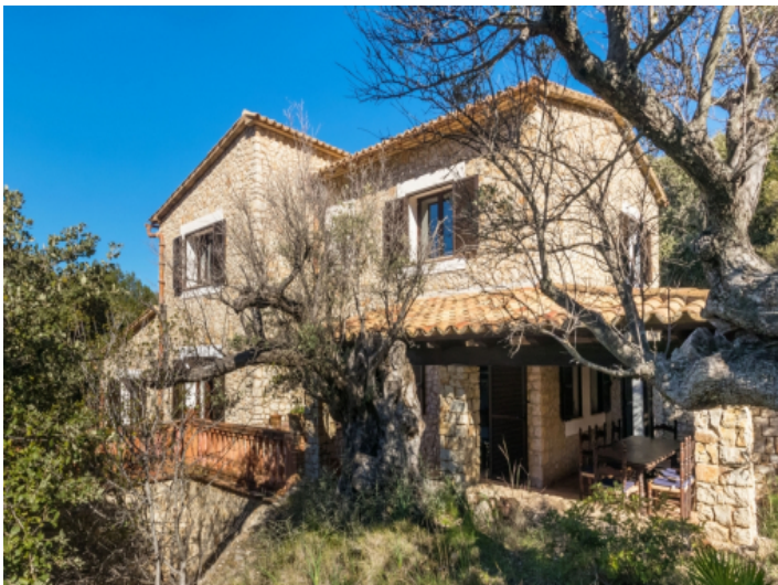
Natur umgibt die Steinfinca