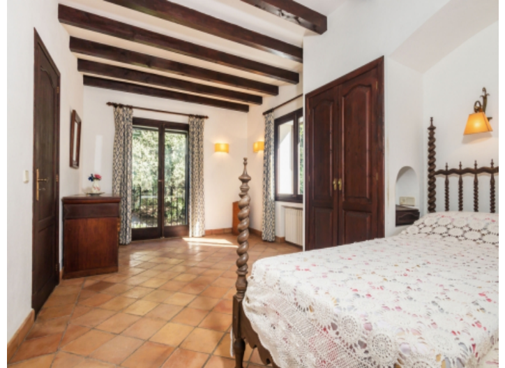
Die Finca strahlt ein angenehmes Ambiente aus