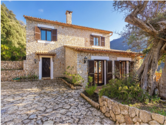
Zugang zur schönen Steinfinca