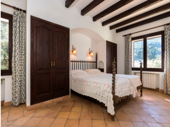
Gemütliches Doppelschlafzimmer mit Einbauschränken