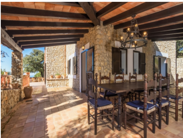
Großer Esstisch auf der überdachten Terrasse