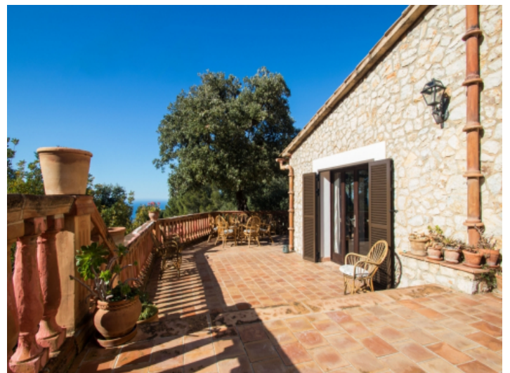
Die Finca befindet sich in einer traumhaften Lage