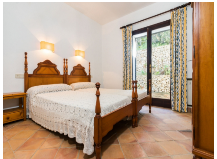
Helles Doppelschlafzimmer mit Terrassenzugang