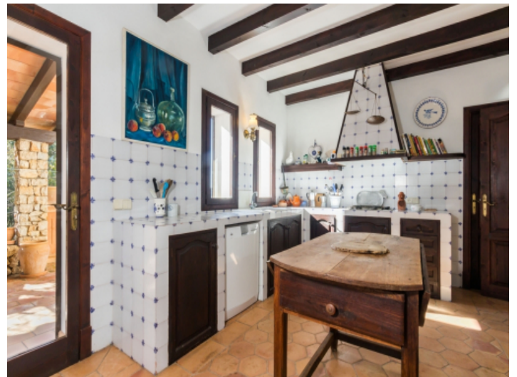
Die Küche bietet einen Zugang zum Außenbereich