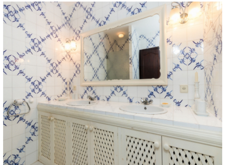
Badezimmer mit Doppelwaschbecken