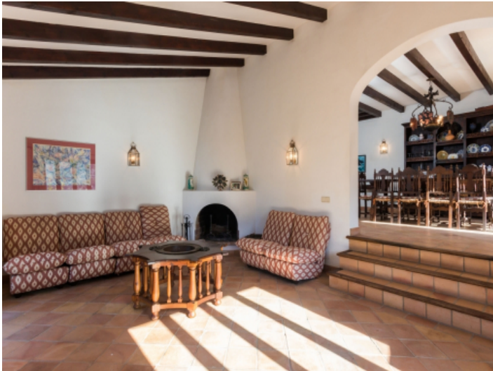
Wohnbereich mit Kaminecke