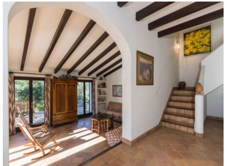
Der Wohnbereich ist sehr lichtdurchflutet