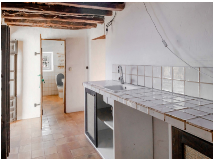
Küche 1. Etage