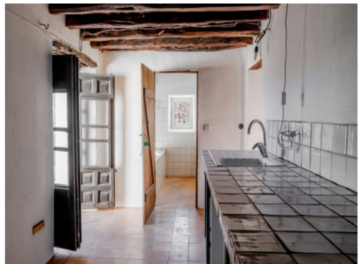
Küche 1. Etage