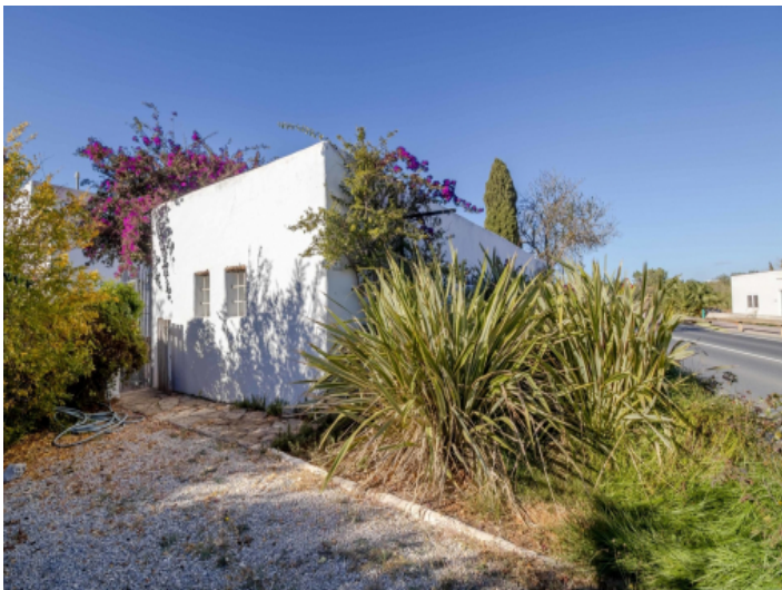
Seitliche Ansicht auf das Objekt