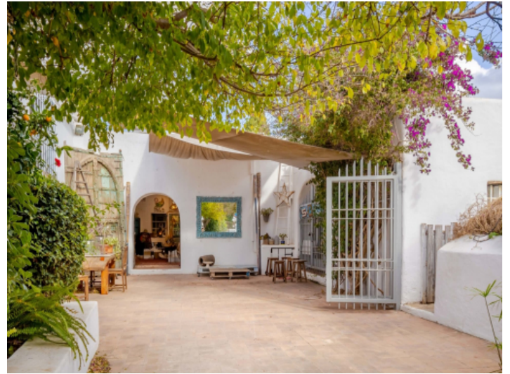
Ansicht auf das Lokal