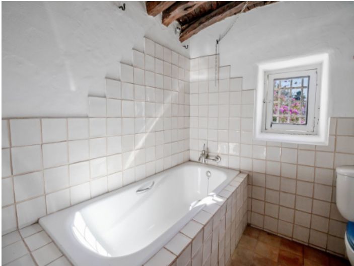
Badezimmer 1. Etage