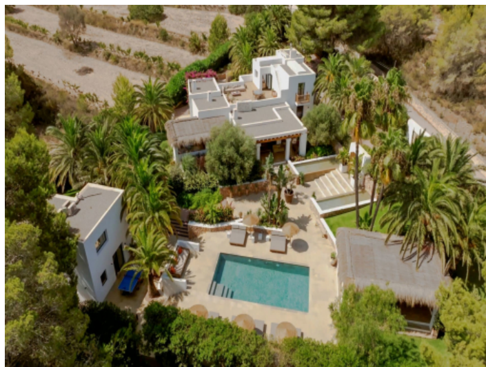
Ansicht auf die Villa