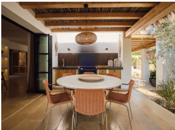
Essbereich auf der Terrasse