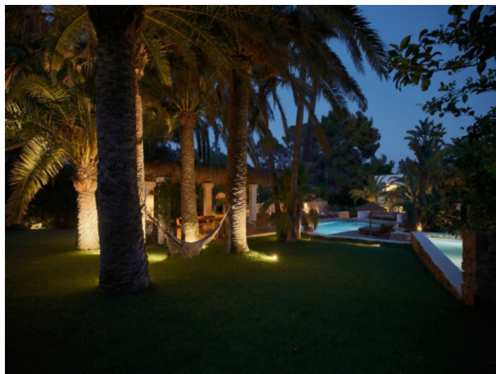
Villa Romaní am Abend