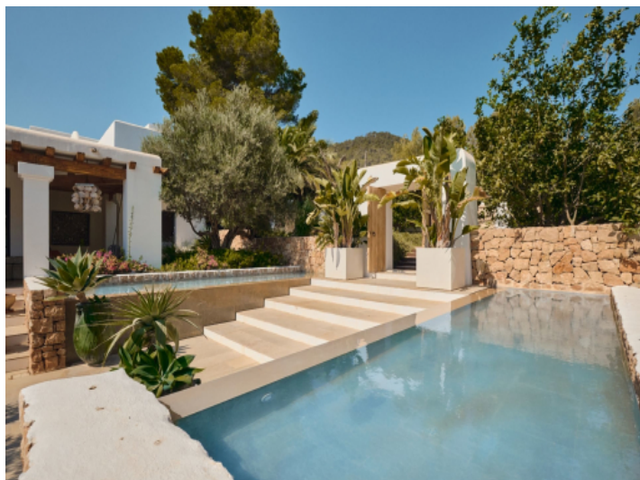
Haupteingang zum Grundstück