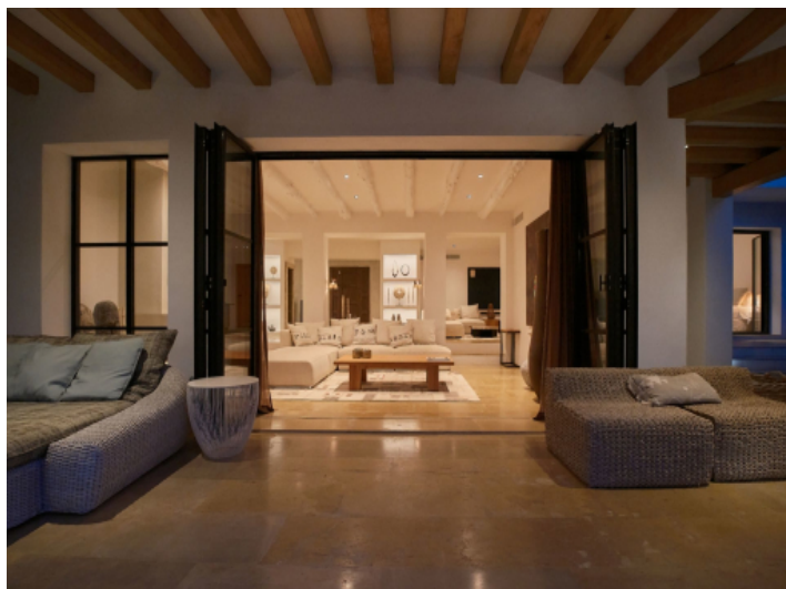
Einblick in den Wohnbereich