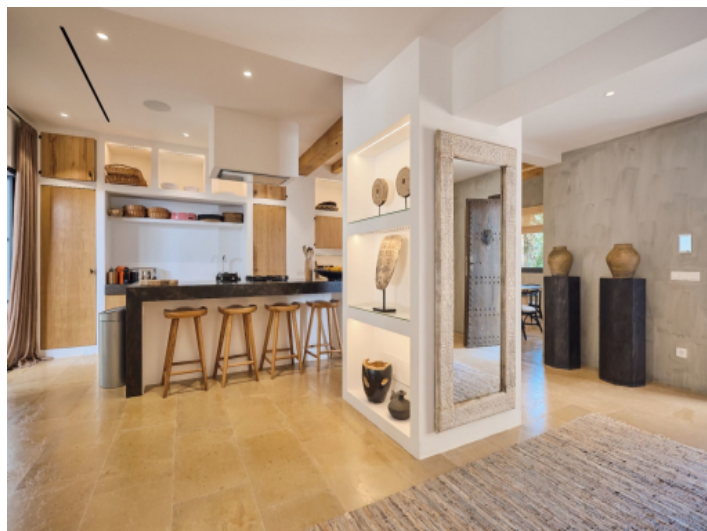
Küche im Landhausstil