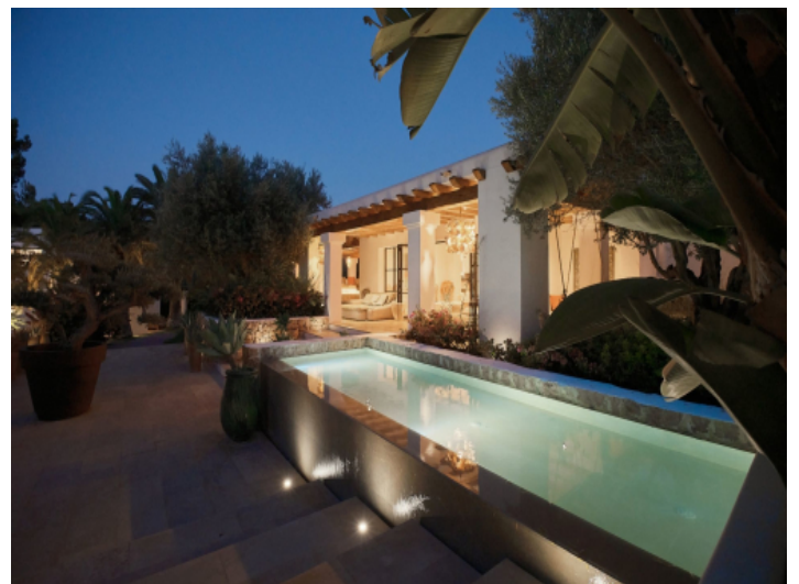
Ansicht auf die Villa