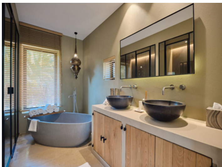
Villa mit 6 Badezimmern