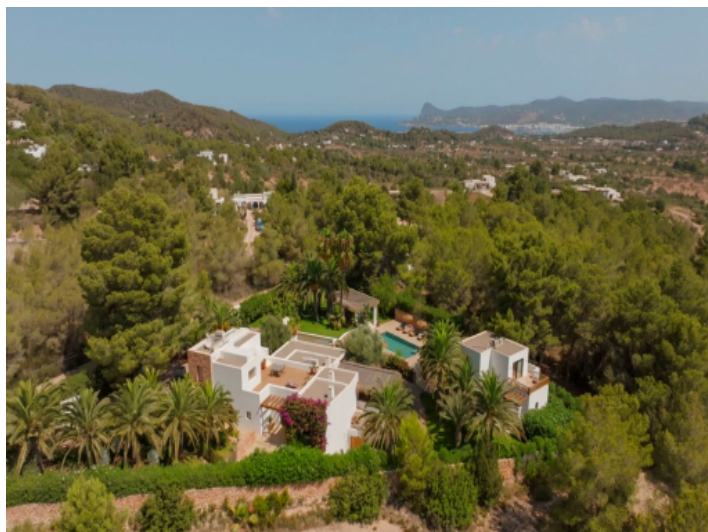
Anicht auf die Villa