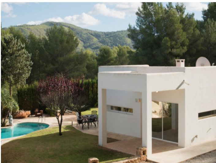
Ansicht auf die Villa