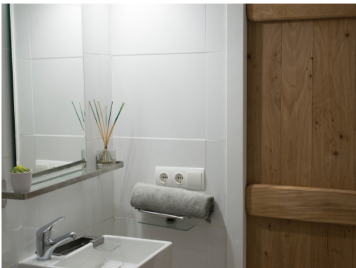
Eines von 4 Badezimmer