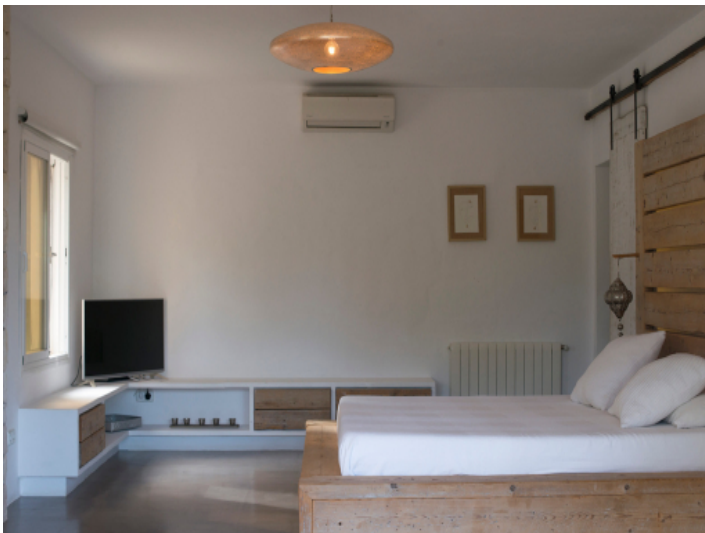
Eines von 6 Schlafzimmern