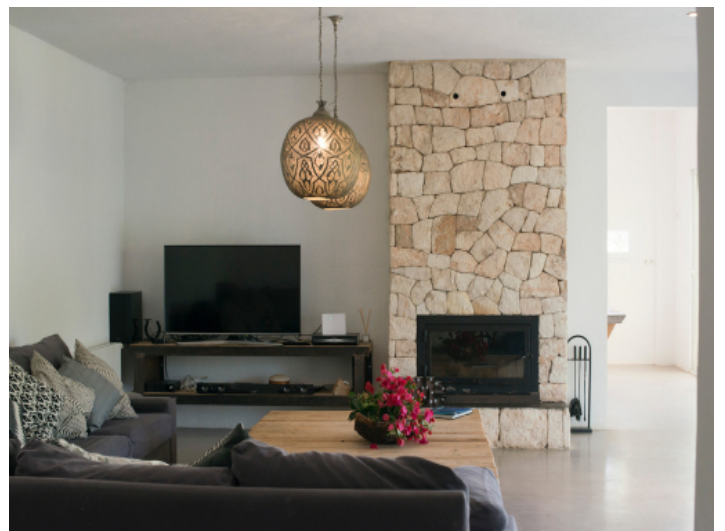
Wohnbereich mit Kamin