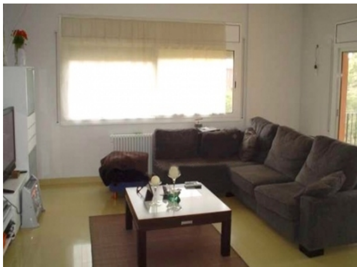
Bright living room