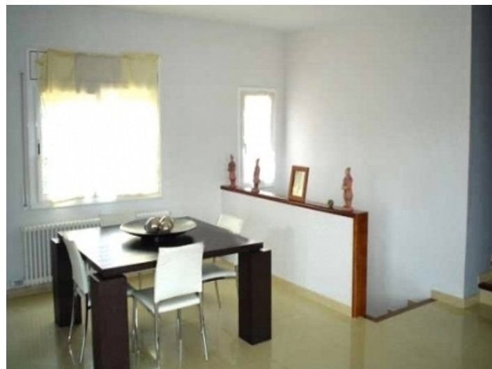
Classy dining room