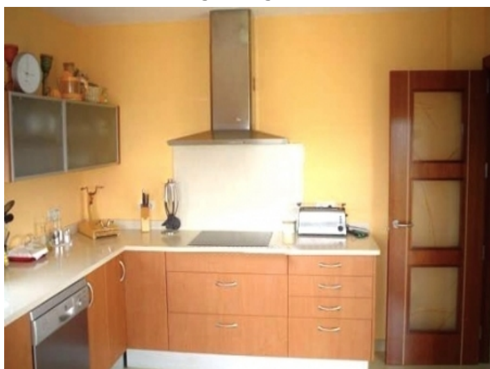
Modern fitted kitchen