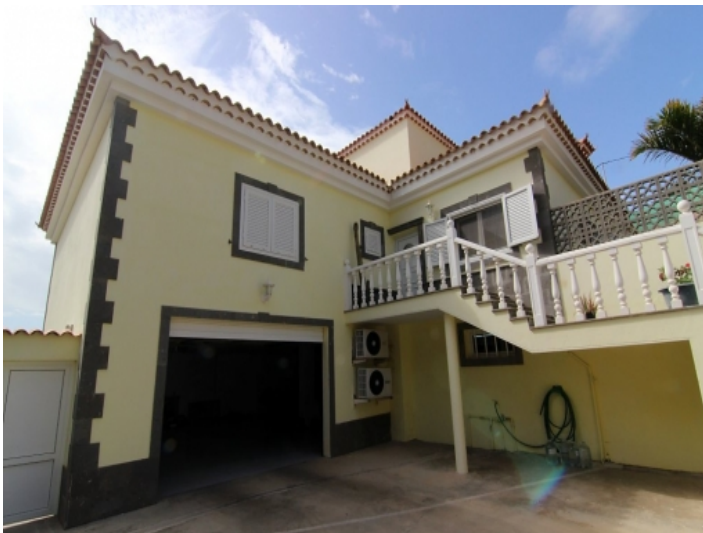
Außenansicht der Villa