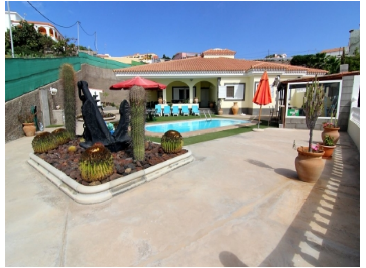
Außenbereich mit Poolbar