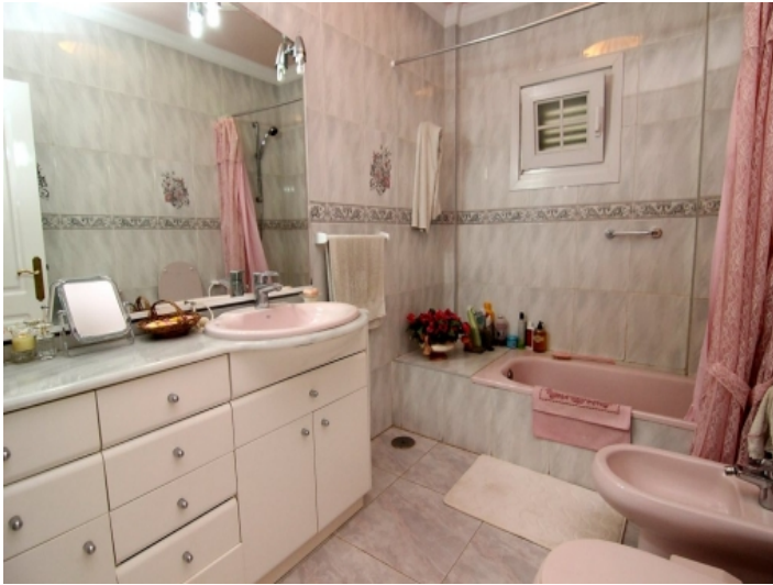
Eines von 5 Badezimmern