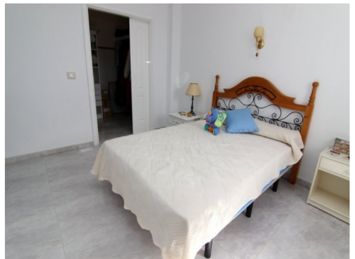
Eines von 4 Schlafzimmern