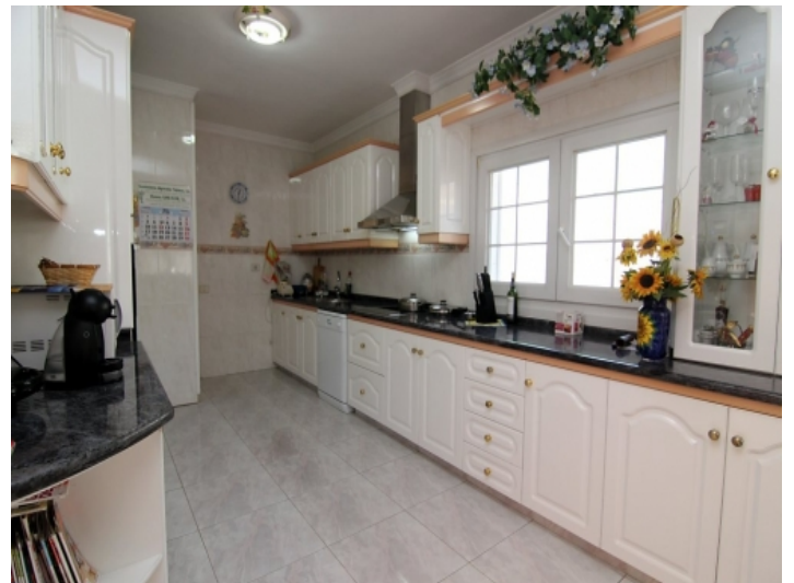
Voll ausgestattete Küche