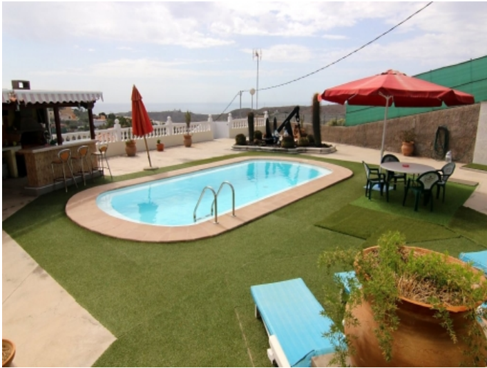
Meerblick vom Poolbereich aus