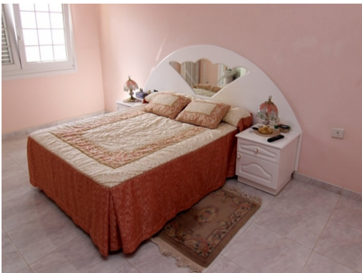
Eines von 4 Schlafzimmern