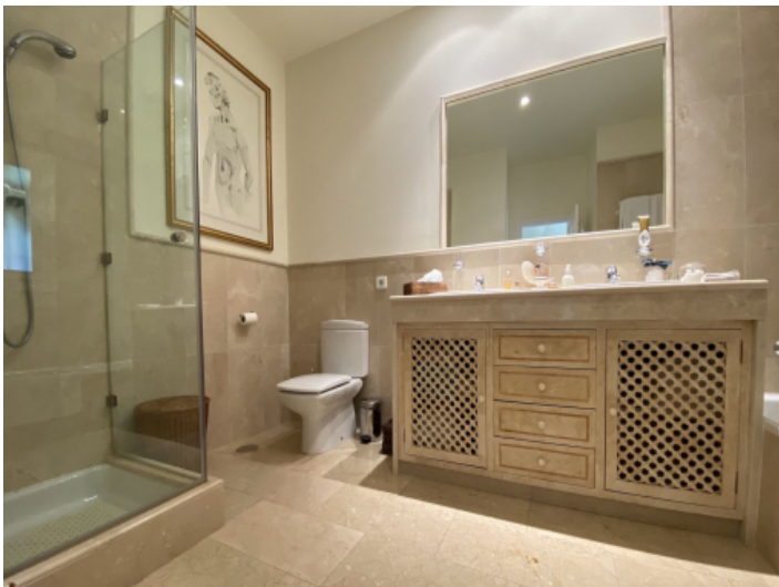
Bad en Suite