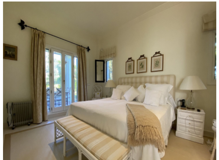
Ein weiteres Schlafzimmer