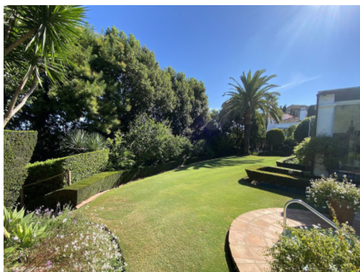
Sehr gepflegter Garten