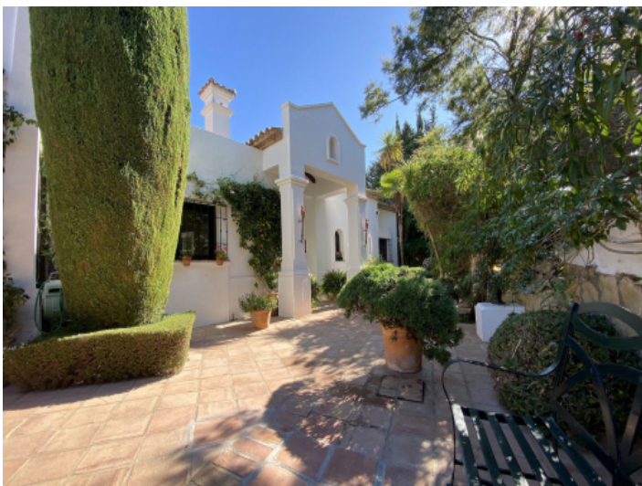
Wunderschöner maurischer Vorgarten