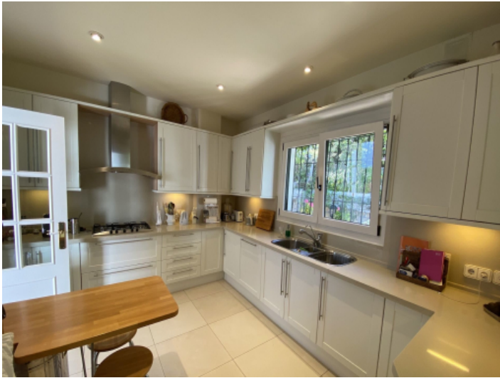
Küche im Landhausstil