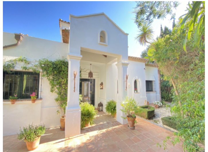
Eingangsbereich und Fassade