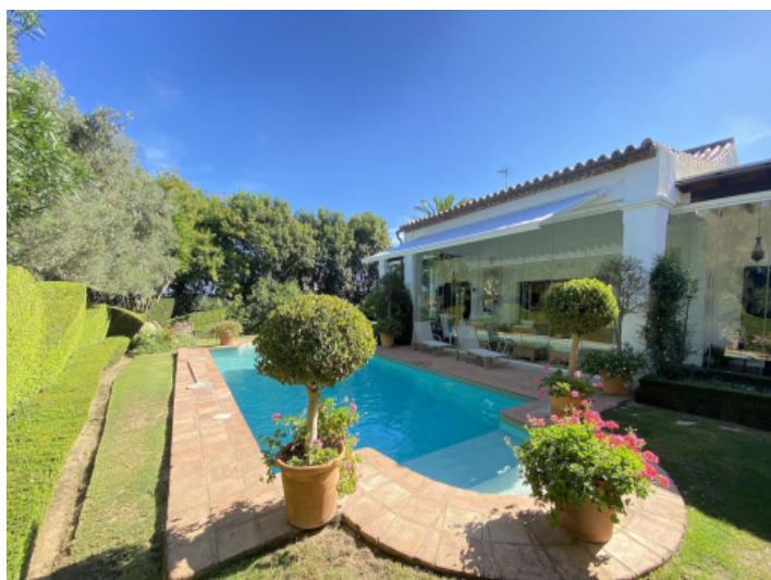
Lifestyle in Sotogrande