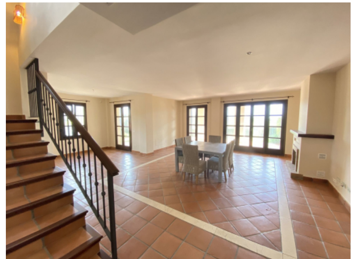
Wohn-/Essbereich mit Kamin