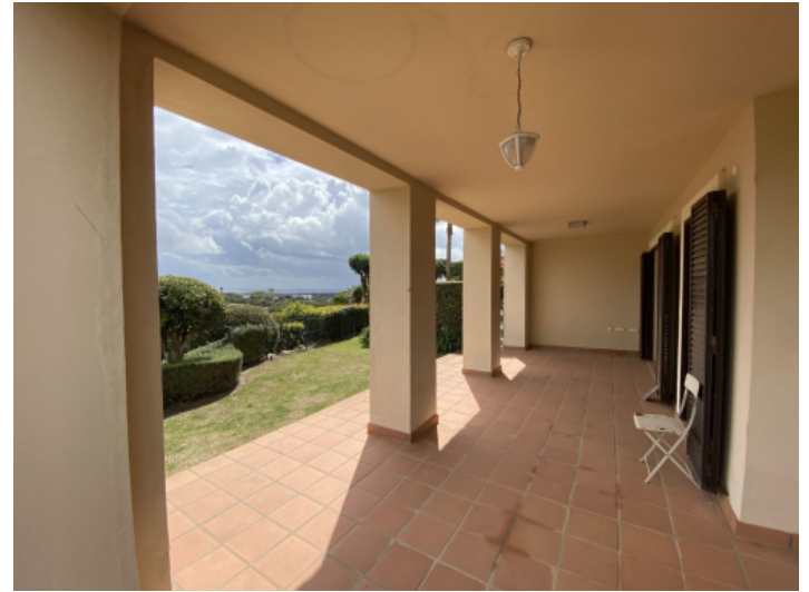
Überdachte Terrasse mit Meerblick