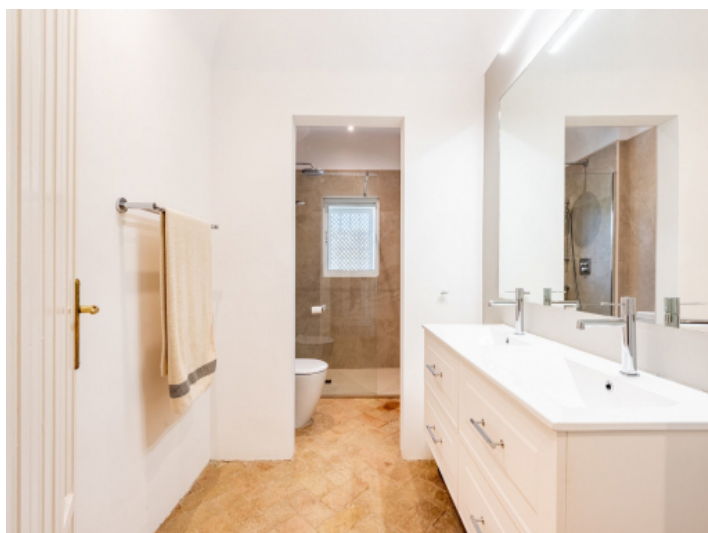
Eines von 5 Badezimmern