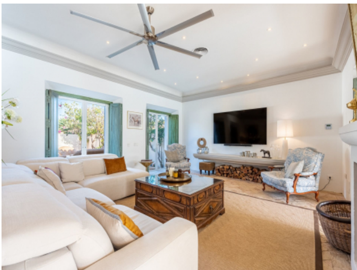
Wohnbereich mit Terrassenzugang