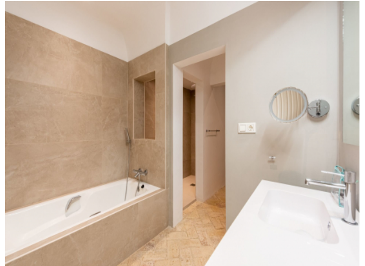
Eines von 5 Badezimmern