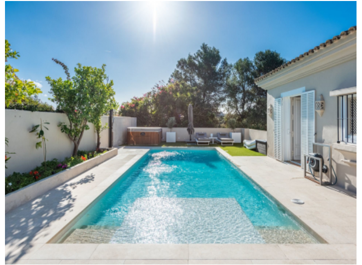
Sehr gepflegter Pool