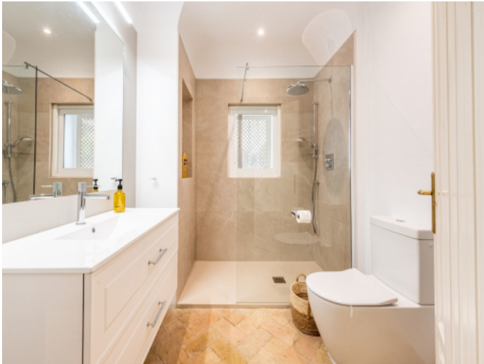
Eines von 5 Badezimmern