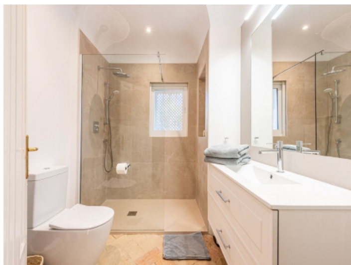
Eines von 5 Badezimmern