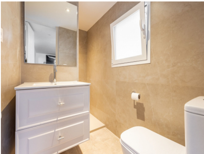
Eines von 5 Badezimmern