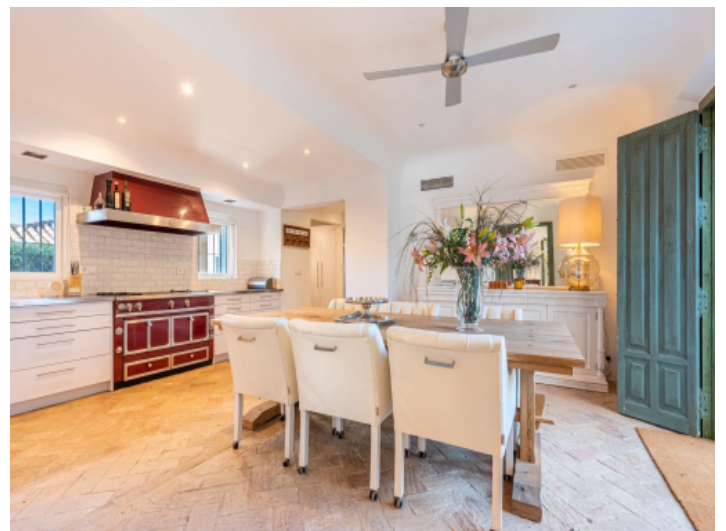
Offene Küche mit Essbereich