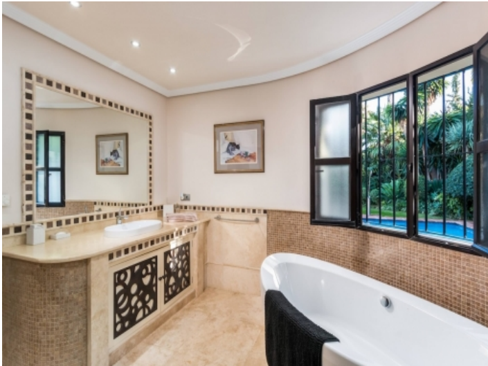
Alternativa Ansicht des Badezimmers