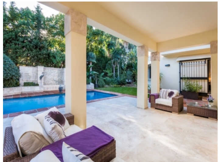
Überdachte Direkter Zugang zum Poolbereich