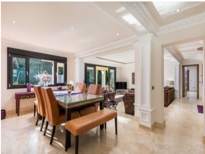
Großzügiger Wohn- und Essbereich