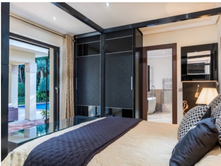
Hauptschlafzimmer mit Badezimmer en Suite und Zugang zur Terasse