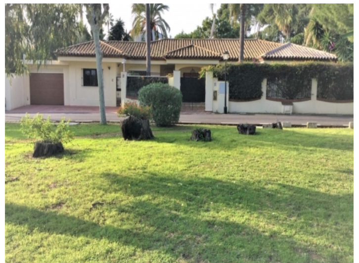
Außenansicht der Villa