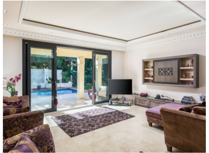
Wohnbereich mit Zugang zur Terasse