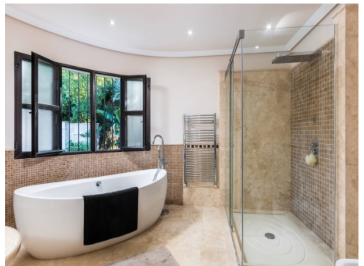
Stilvolles Badezimmer en Suite