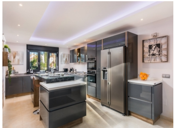
Voll ausgestattete Designerküche