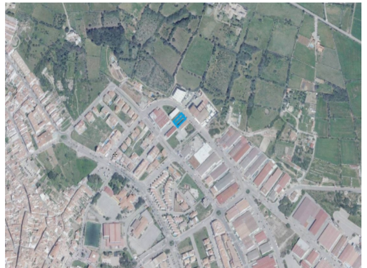
Location of the plot