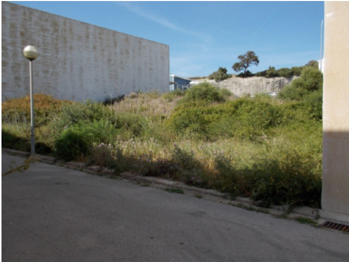
Ansicht des Grundstücks