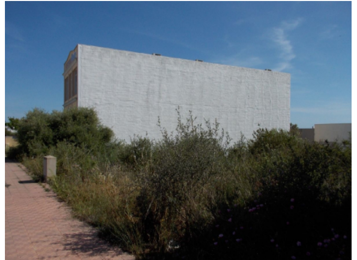
Alternative Ansicht des Grundstücks