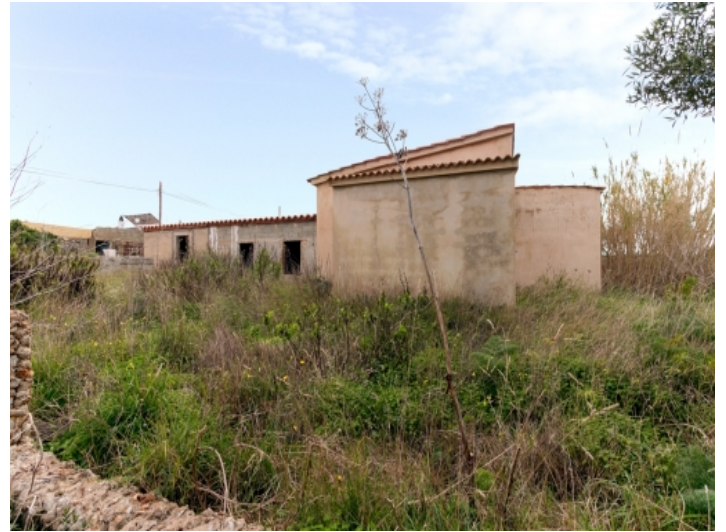
Alternative Ansicht des Grundstücks