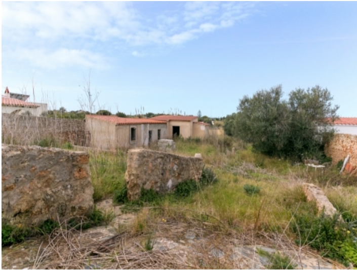
Alternative Ansicht des Grundstücks