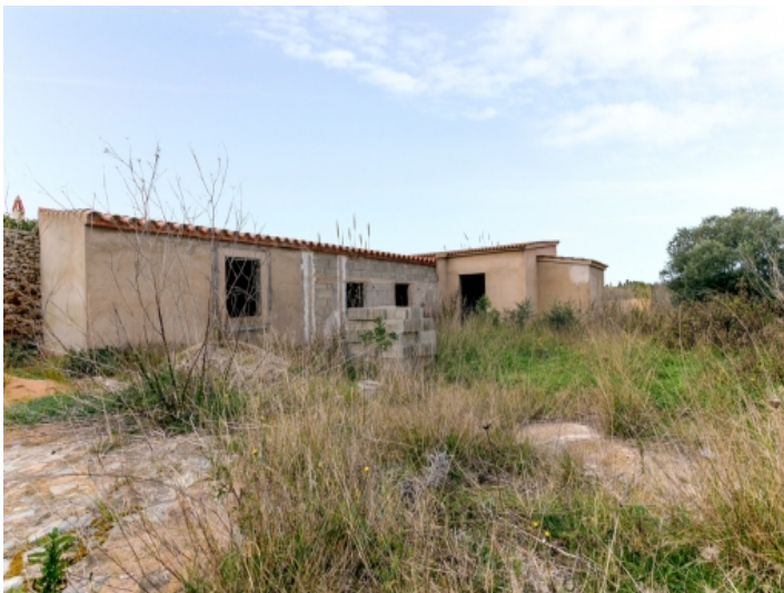
Alternative Ansicht des Grundstücks