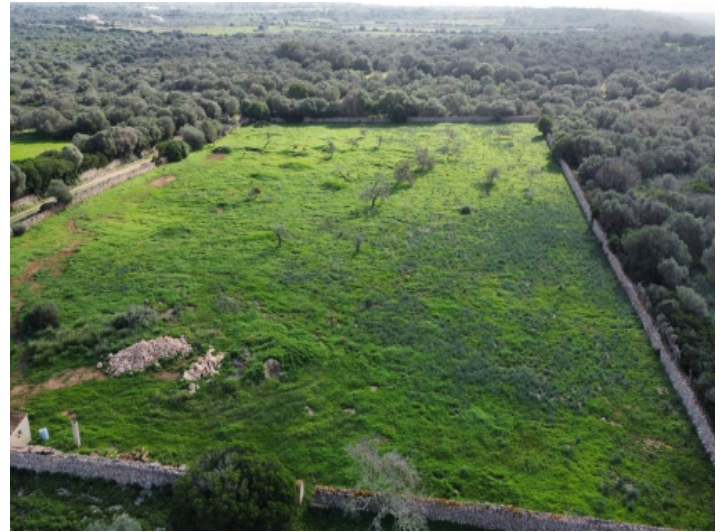
Grundstück mit Weitsicht