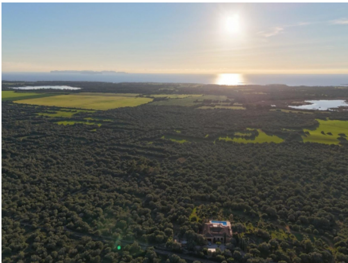
Blick auf Cabrera