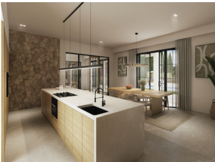
Küche mit angrenzendem Essbereich