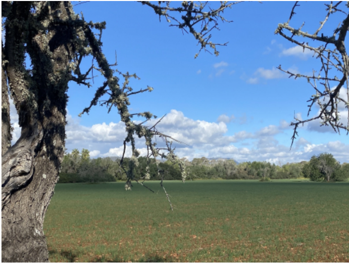
Grundstück mit Blick auf Randa