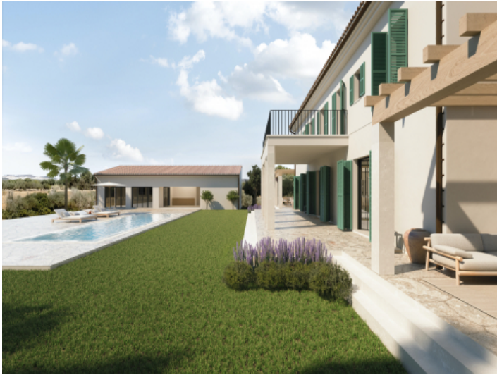
Fincaprojekt mit Pool