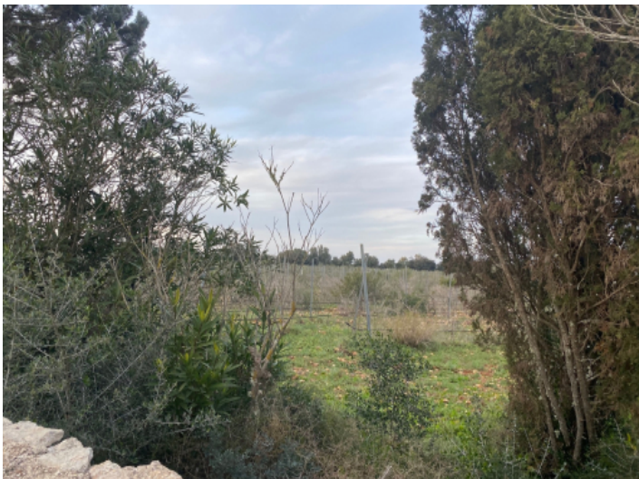
zentrale gelegenes Grundstück