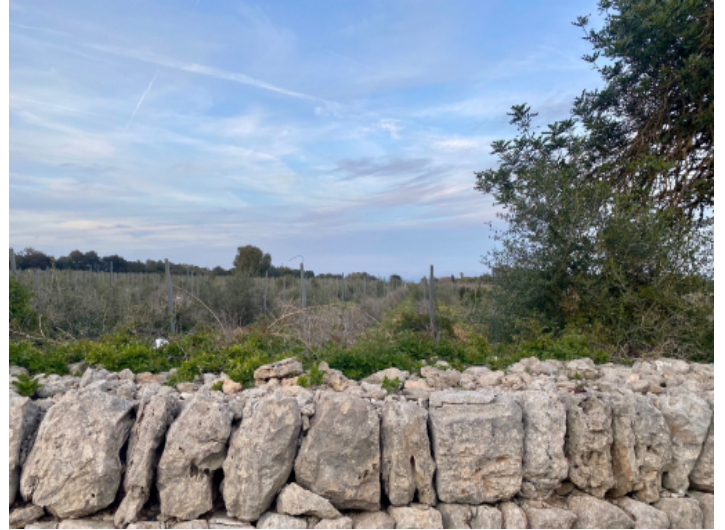
Grundstück mit herrlichen Weitblick