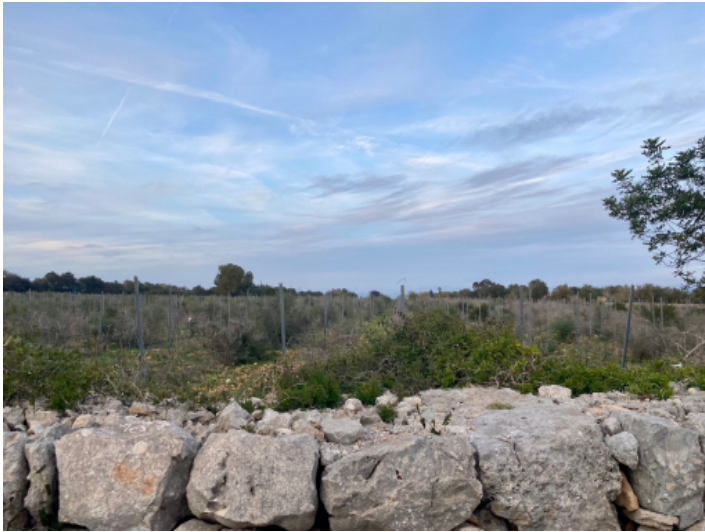
Grundstück mit Blick auf die Landschaft