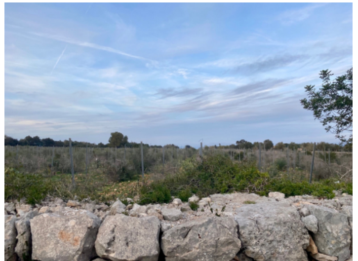
Grundstück mit Blick auf die Landschaft