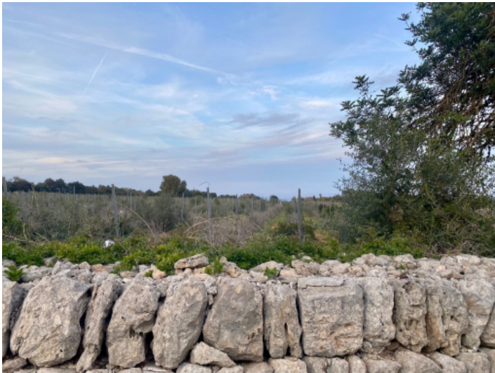
Grundstück mit herrlichen Weitblick