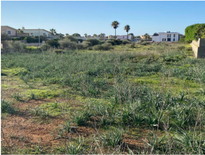
Grundstück, Sa Rapita