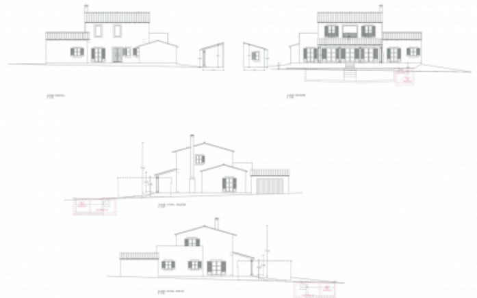
Fassadenansicht der projektierten Finca