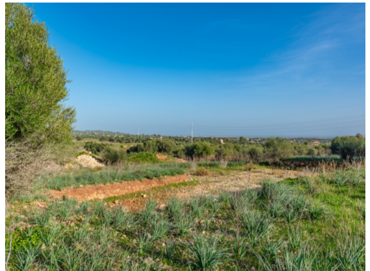
Nah zu Porto Cristo und Manacor