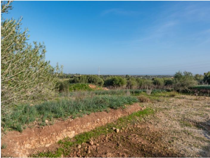
Im Außenbereich ist ein ca. 69 qm großer Pool mit