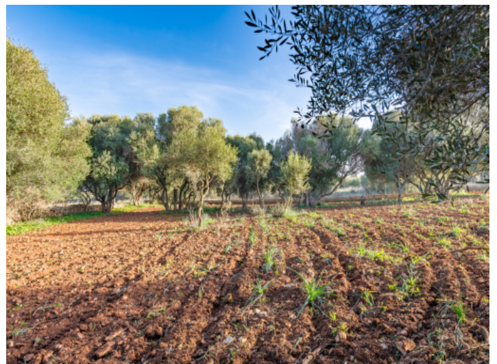
Das Grundstück besitzt ein bereits genehmigtes Bauprojekt für ein Landhaus mit Pool