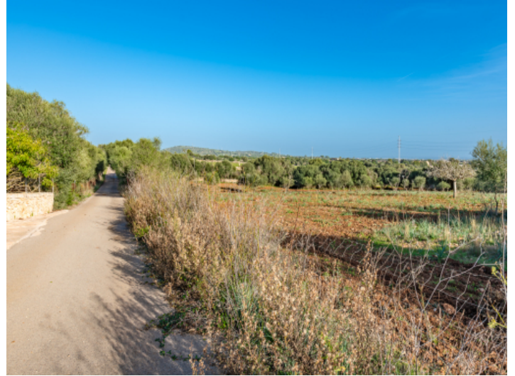
Asphaltierter Weg zum Grundstück