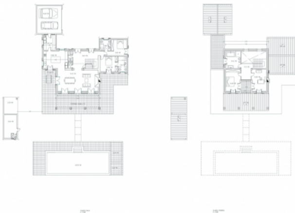
Grundriss der projektierten Finca