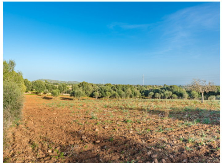
Ca. 15.120 qm große Traumgrundstück