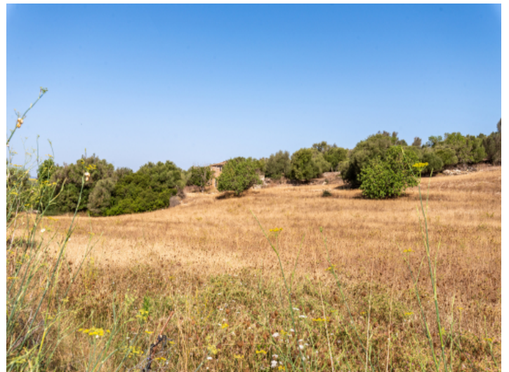
Grundstück mit Baugenehmigung