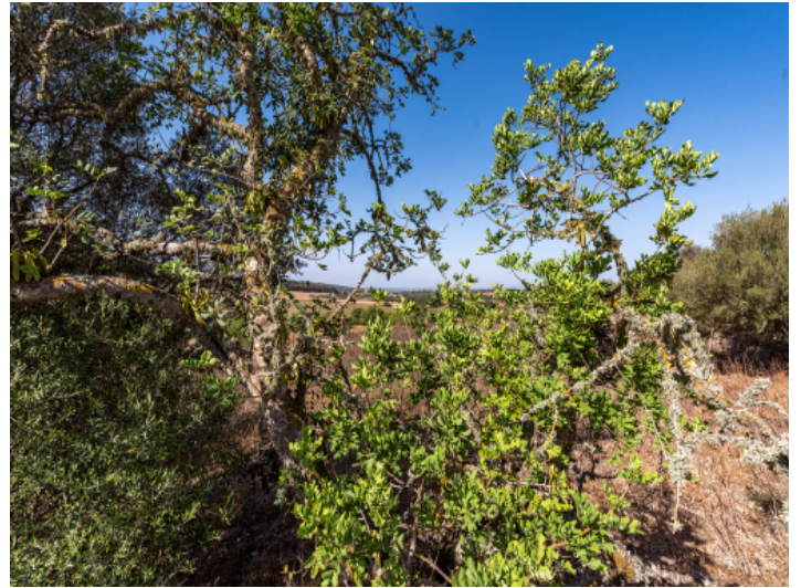
Grundstück mit Baugenehmigung