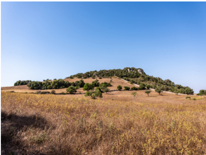
Grundstück mit Baugenehmigung