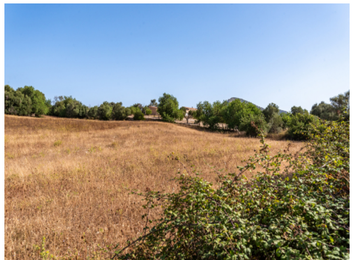
Grundstück mit Baugenehmigung