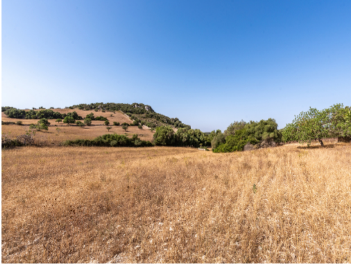
Grundstück mit Baugenehmigung