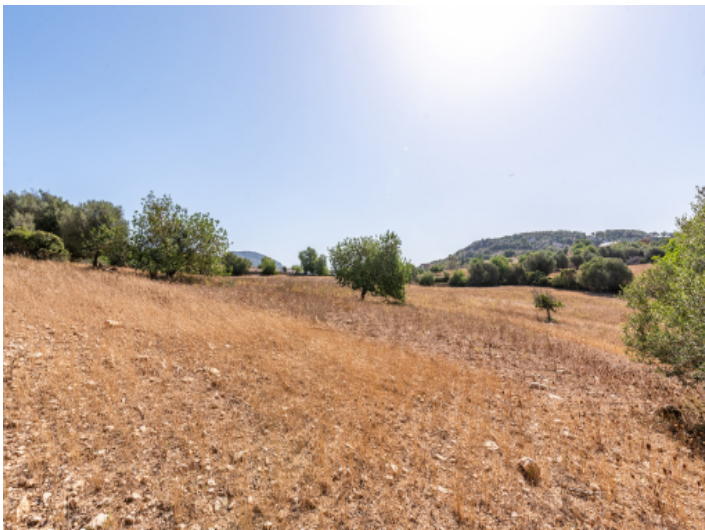
Grundstück mit Baugenehmigung