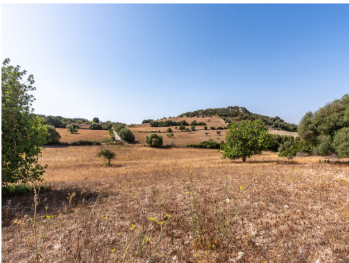
Grundstück mit Baugenehmigung