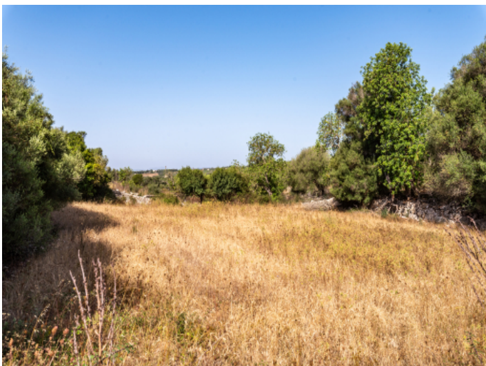
Grundstück mit Baugenehmigung