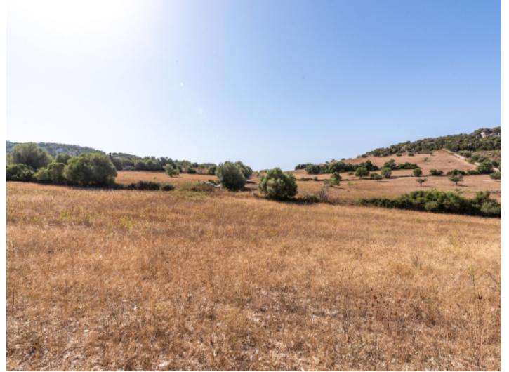
Grundstück mit Baugenehmigung