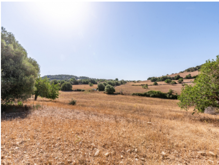
Grundstück mit Baugenehmigung