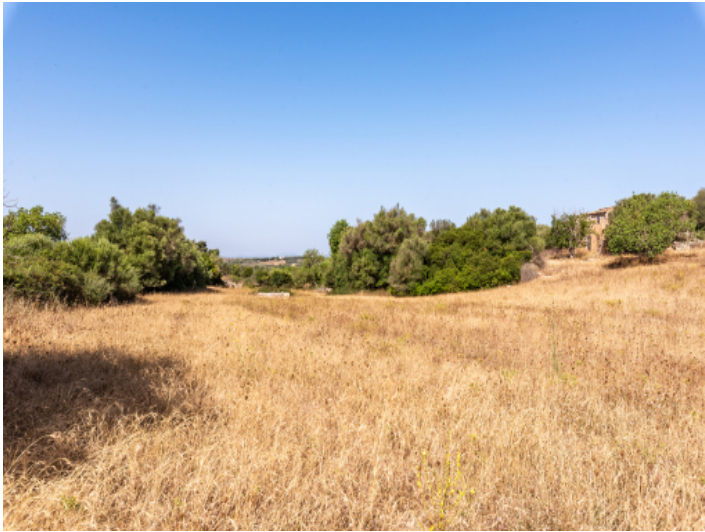
Grundstück mit Baugenehmigung