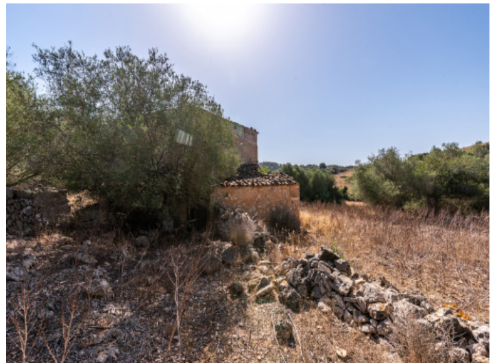
Grundstück mit Baugenehmigung