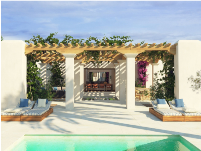
Grundstück mit Bauprojekt