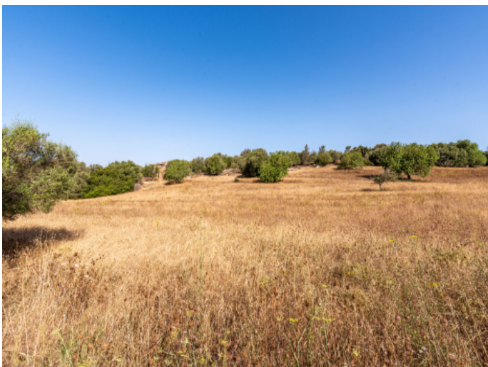
Grundstück mit Baugenehmigung