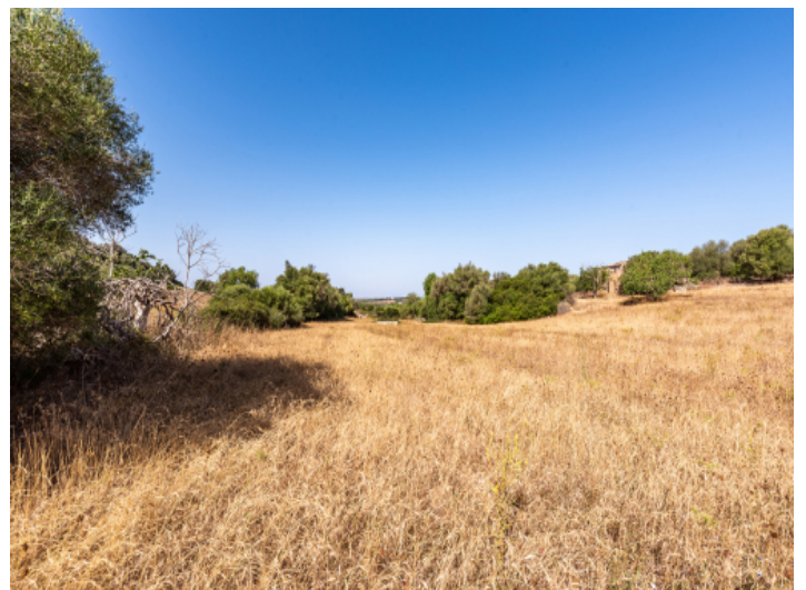
Grundstück mit Baugenehmigung