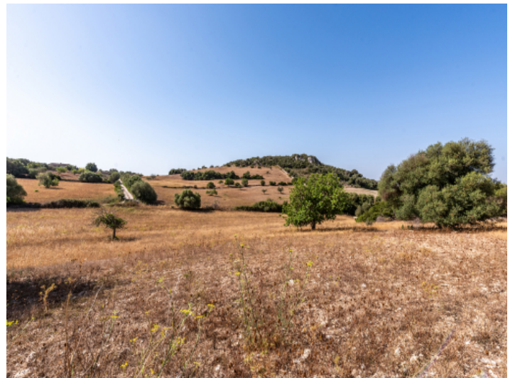
Grundstück mit Baugenehmigung