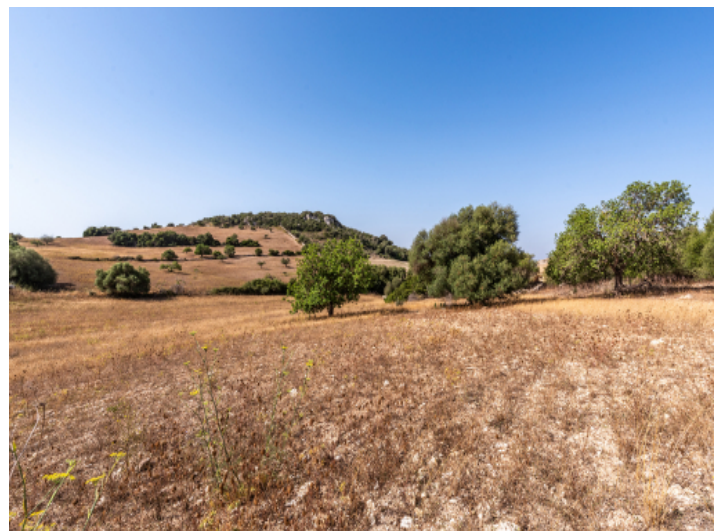
Grundstück mit Baugenehmigung