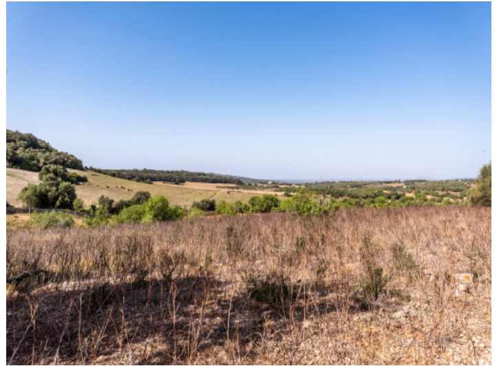
Grundstück mit Weitblick