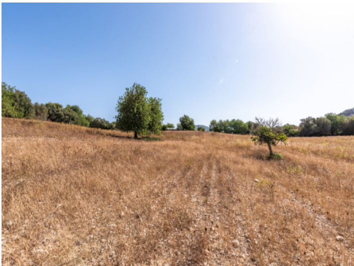
Grundstück mit Baugenehmigung