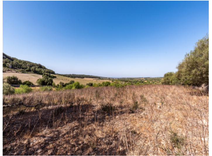
Grundstück mit Baugenehmigung