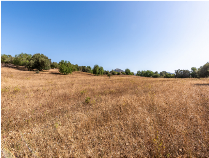
Grundstück mit Baugenehmigung