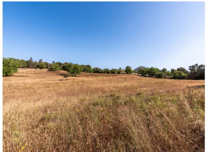
Grundstück mit Baugenehmigung