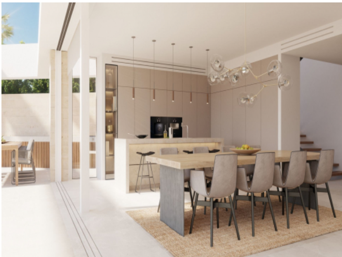
Essbereich- und Küche