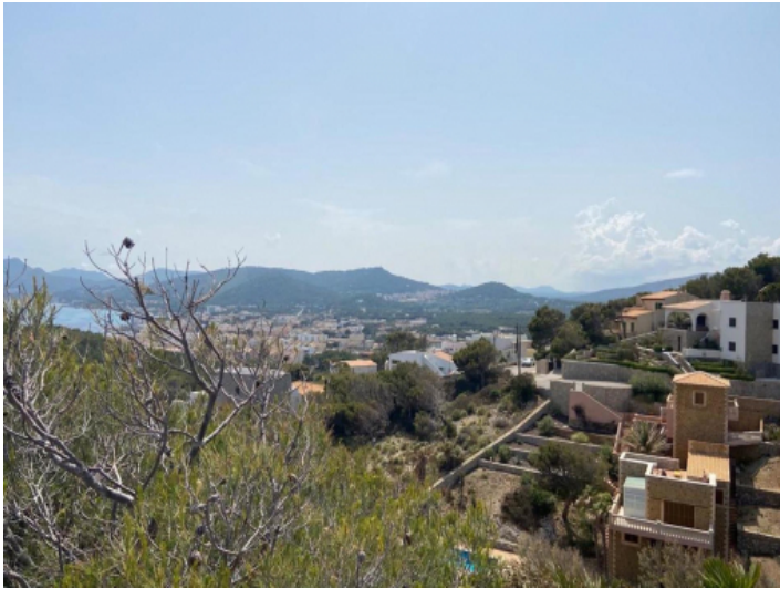
Meerblick Grundstück in Capdepera