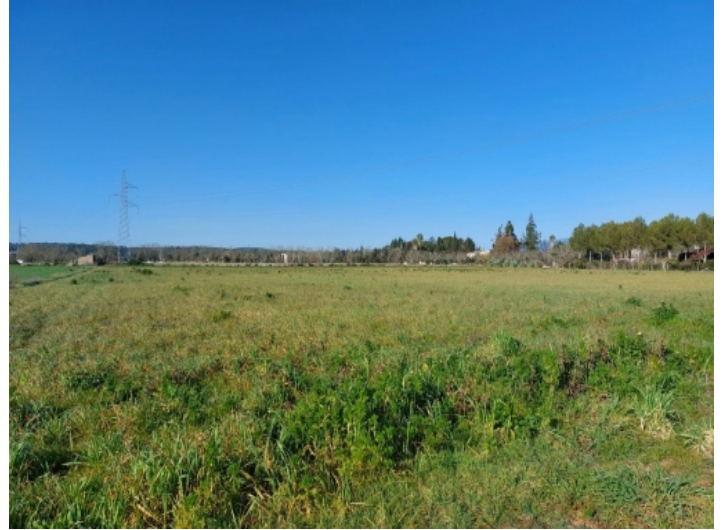
Ansicht des Grundstücks