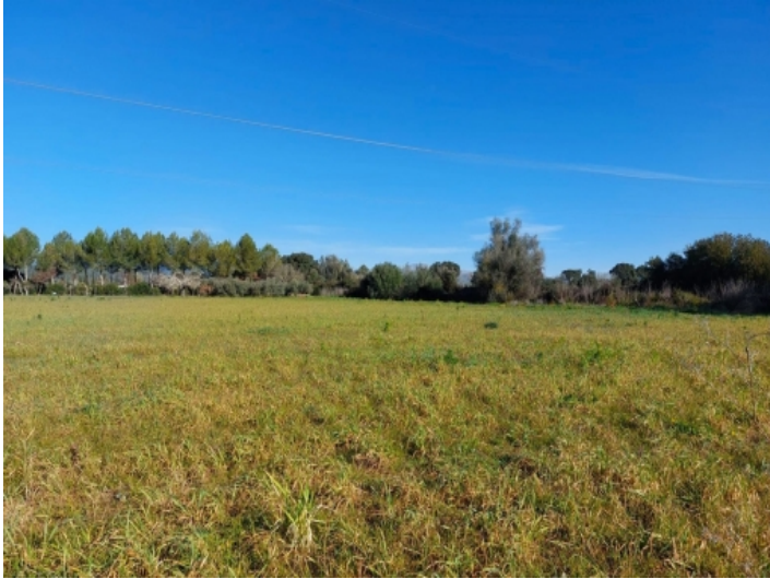
Ansicht des Grundstücks