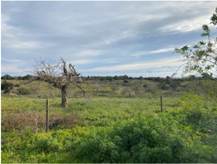
Ansicht des Grundstücks