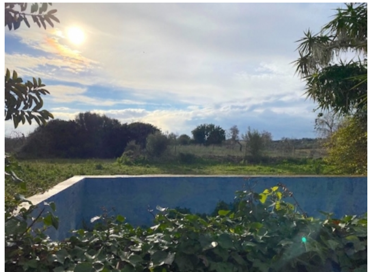
Blick auf das Grundstück