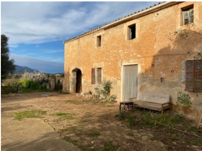
Außenansicht des Hauses