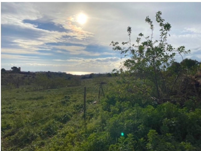
Blick auf das Grundstück