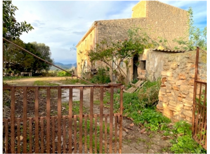
Außenansicht des Hauses