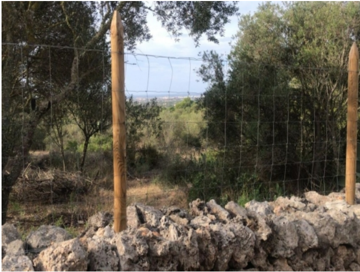
Ansicht des Grundstücks