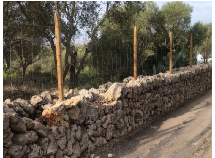
Ansicht des Grundstücks