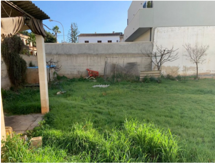
Ansicht des Grundstücks