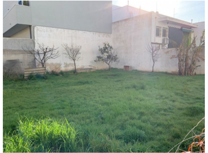
Ansicht des Grundstücks