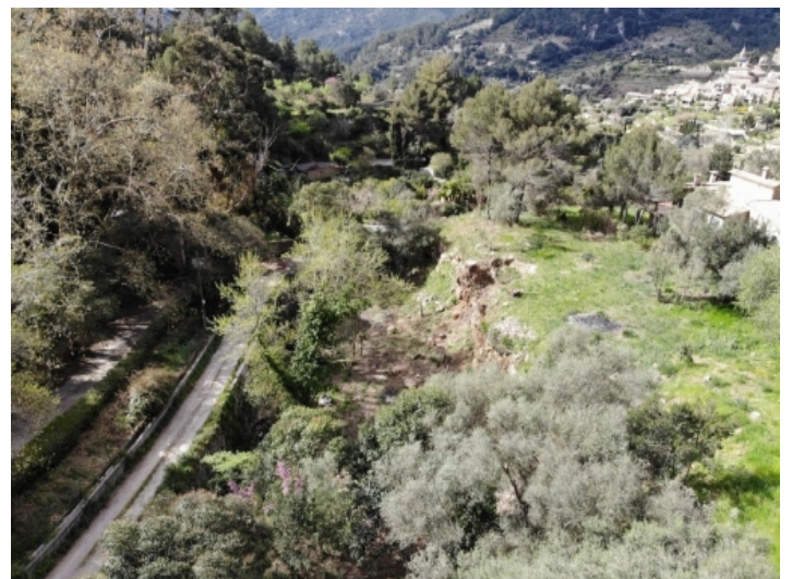
Ansicht des Grundstückes nach Westen