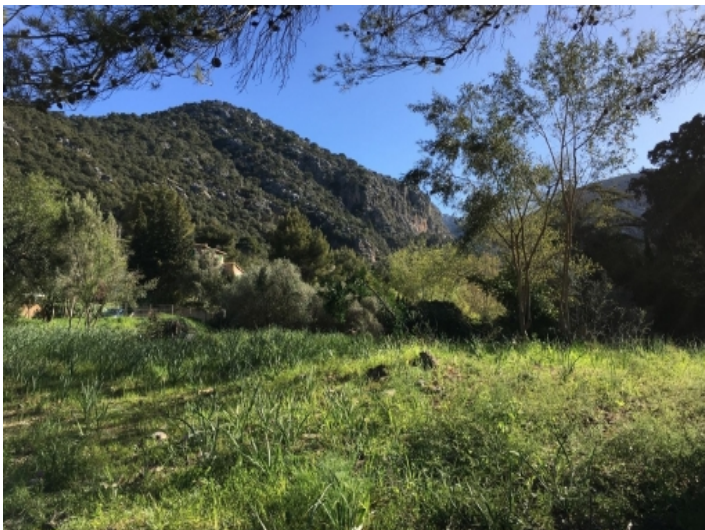
Ansicht des Grundstückes nach Osten