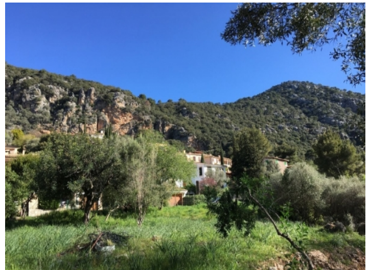
Ansicht des Grundstückes nach Norden