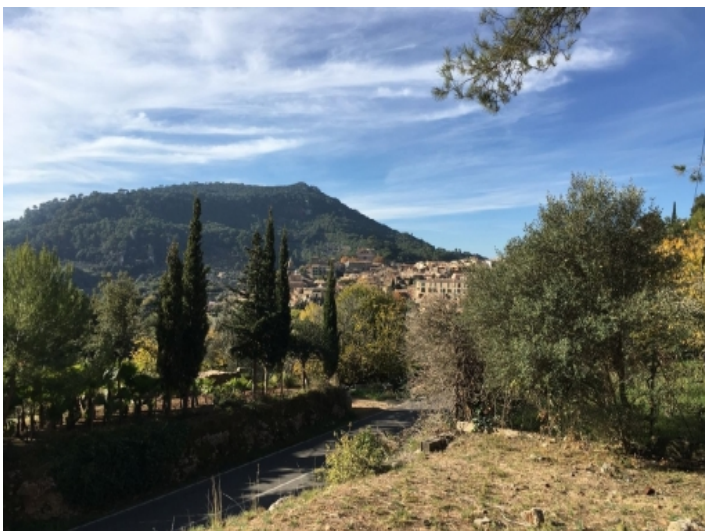
Ansicht des Grundstückes nach Westen