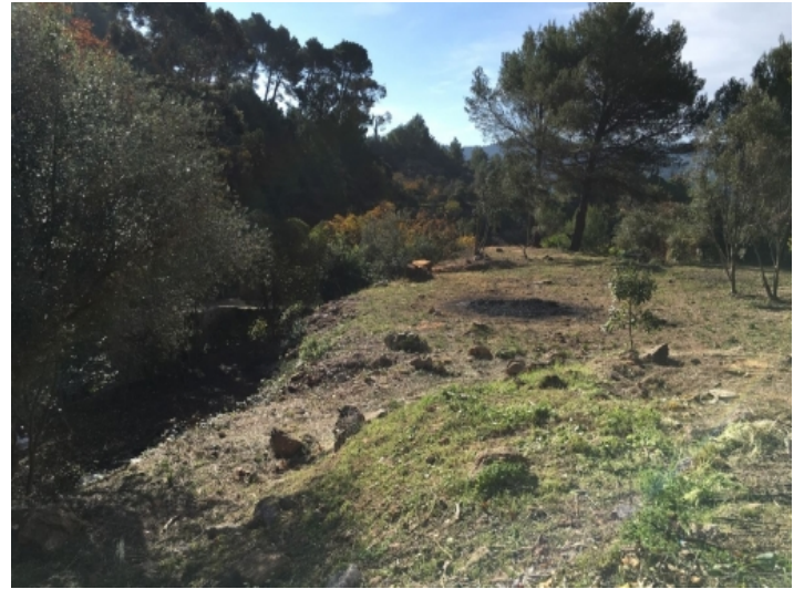
Ansicht des Grundstückes nach Südwesten