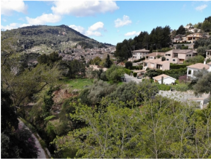
Traumhafter Blick auf das Dorf