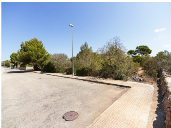
Blick von der Straße