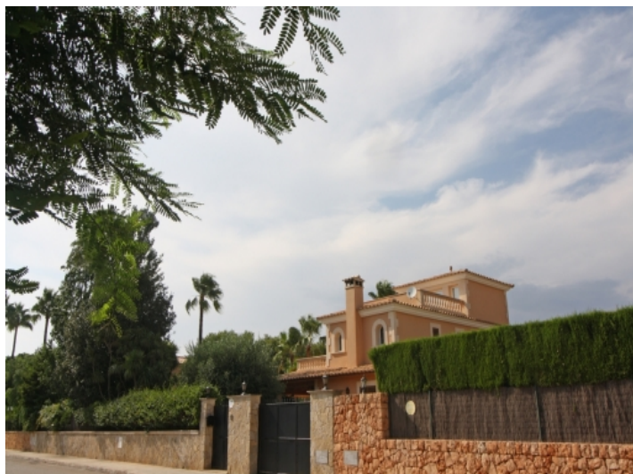
Ansicht der Nachbarschaft