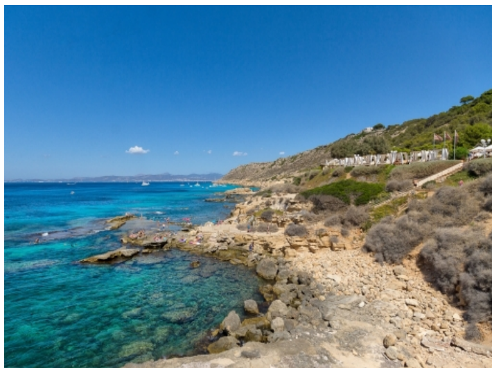
Die Küste von Puig de Ros