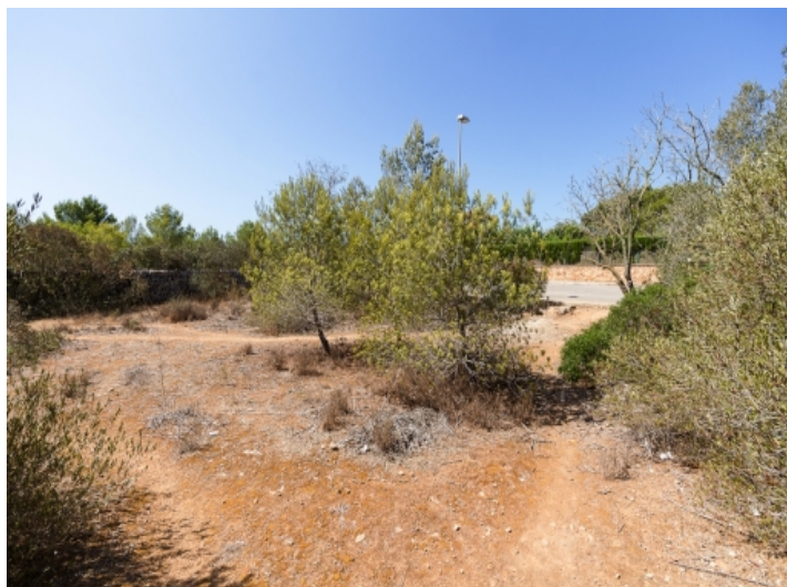
Ansicht des Grundstücks