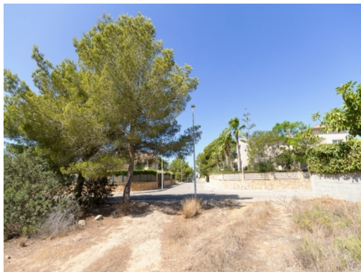
Blick zur Straße hin