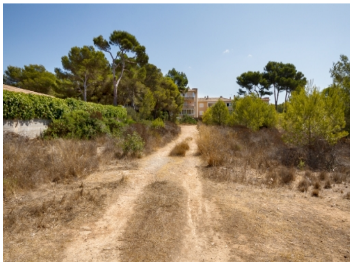
Ansicht des Grundstücks