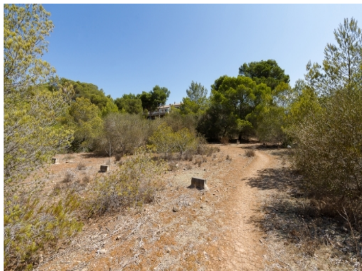
Ansicht des Grundstücks