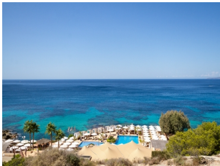
Blick zum Beachclub