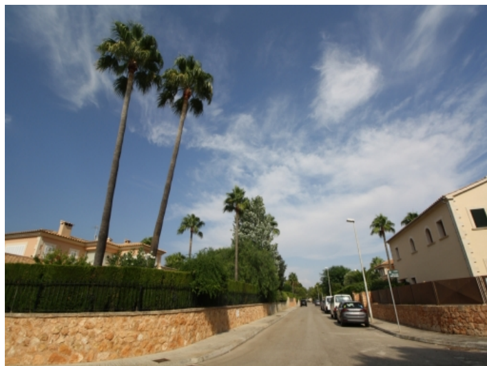
Ansicht der Nachbarschaft