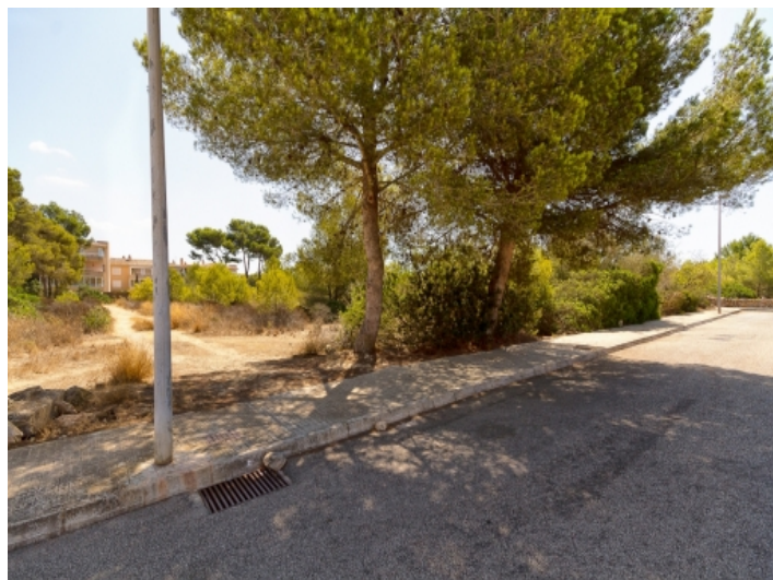
Blick von der Straße