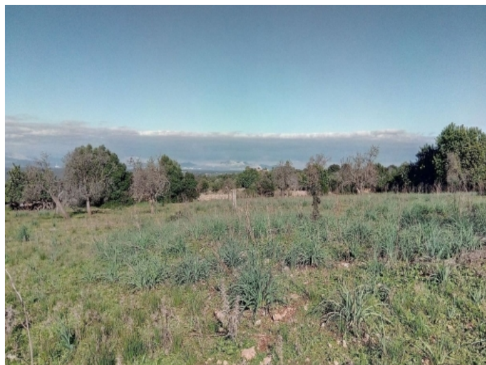
Das Grundstück hat eine Größe von 17.400 qm