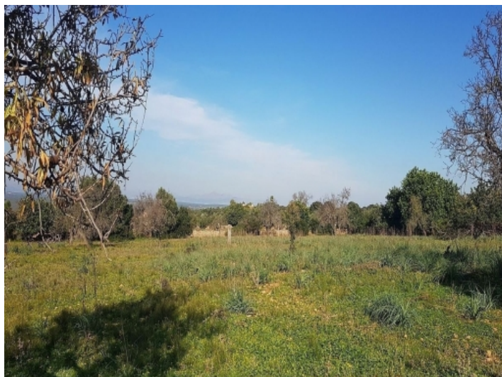
Es ist von einer Natursteinmauer umgeben