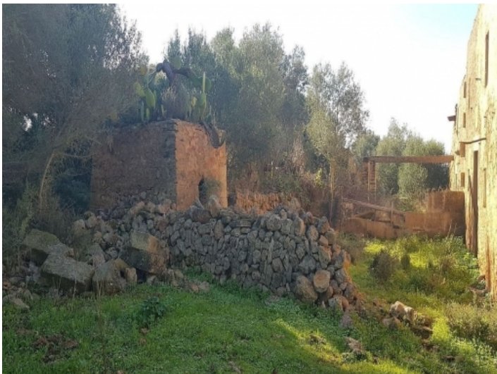
Es liegt ein Basis-Bauprojekt vor