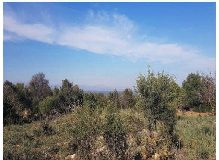
Das Grundstück befindet sich zwischen Colonia Sant Pere und Manacor

PORTA MALLORQUINA • C./ COLOM 20 2º, 07001 PALMA, SPANIEN