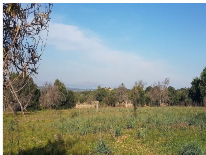
Sie können den Bergblick genießen