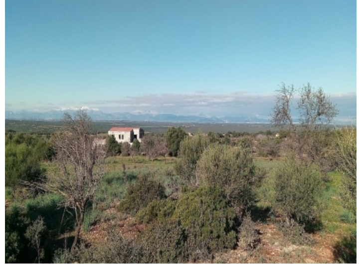
Das Grundstück hat eine erhöhte Lage