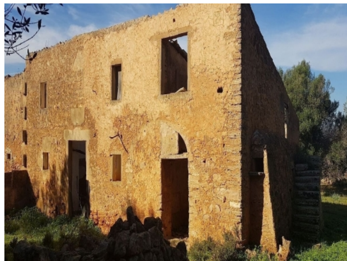
Der neue Eigentümer kann das Projekt anpassen