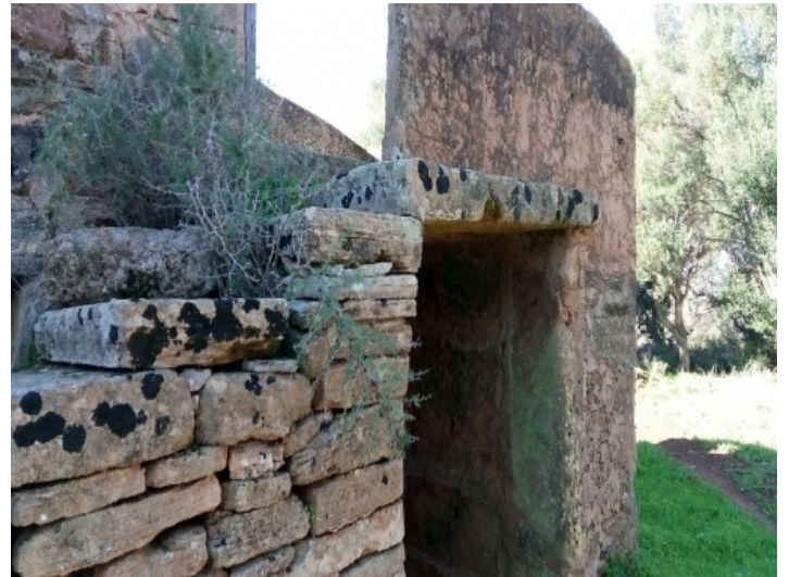
Bauwerk aus Stein