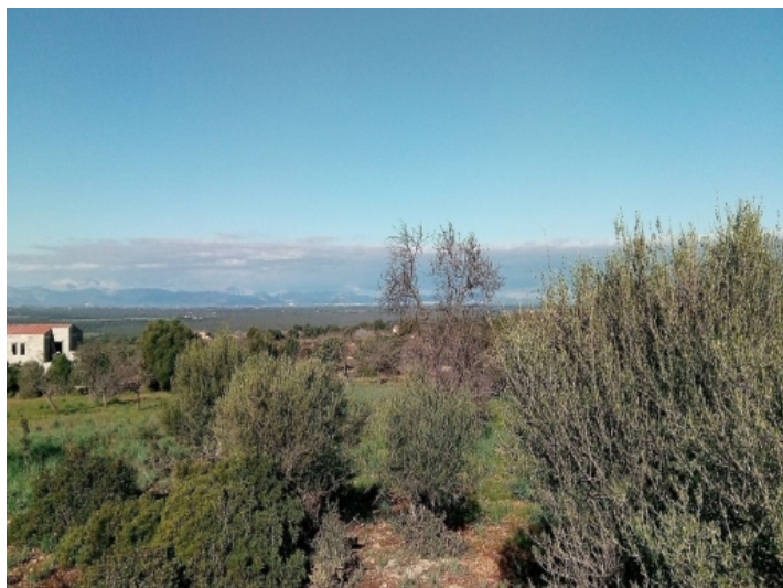
Aussicht auf das Tramuntana Gebirge