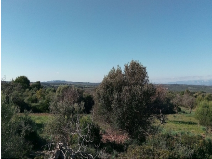
Olivenbäume auf dem Grundstück