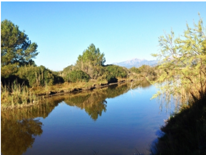
Blick von der Rückseite des Grundstückes auf den Kanal des