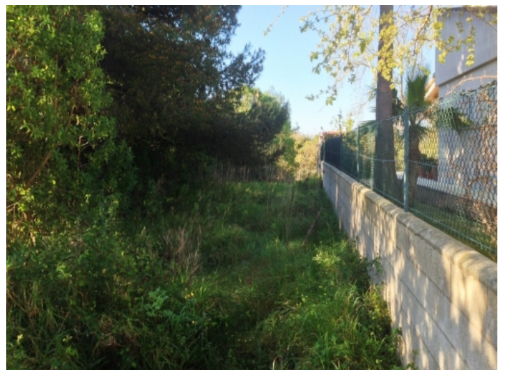
Grundstück von 600 qm

PORTA MALLORQUINA • C./ COLOM 20 2º, 07001 PALMA, SPANIEN