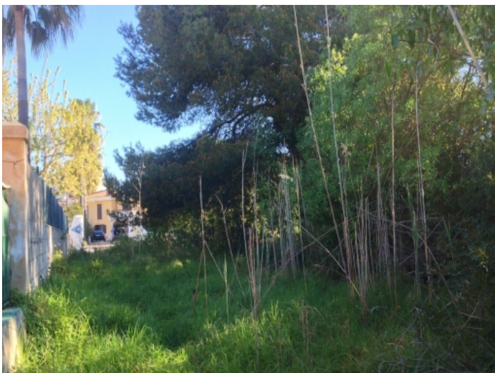
Blick von der Rückseite des Grundstückes in Richtung auf die Vorderseite