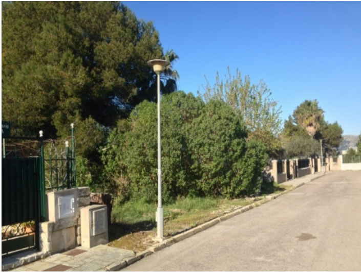
Ansicht des Grundstückes