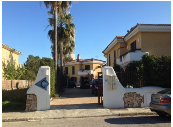
Blick auf den Nachbarn von der Vorderseite des Grundstücks