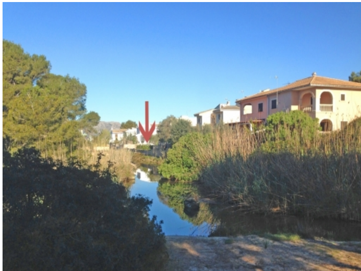
Lage des Grundstücks