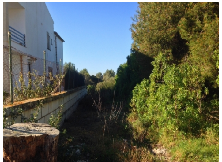
Seitenansicht des Grundstückes