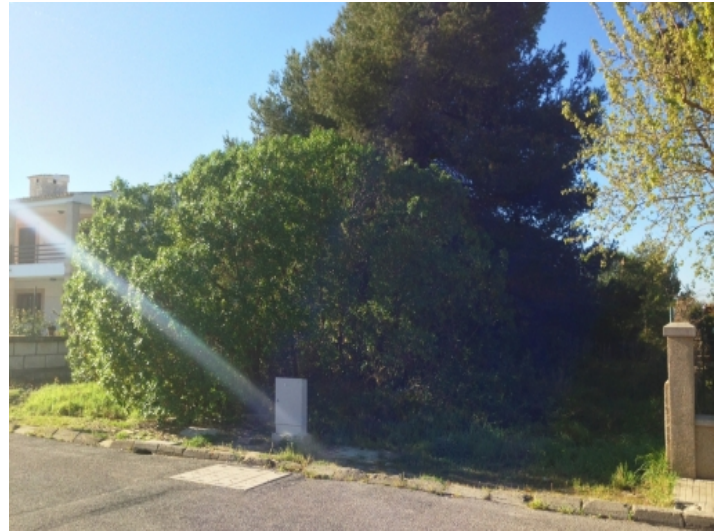
Alternative Ansicht des Grundstückes