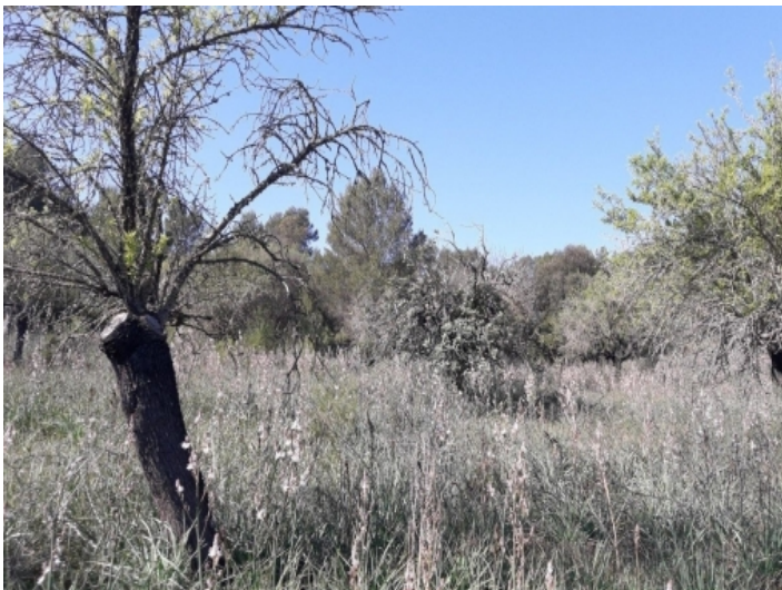
Alter Baumbestand vorhanden