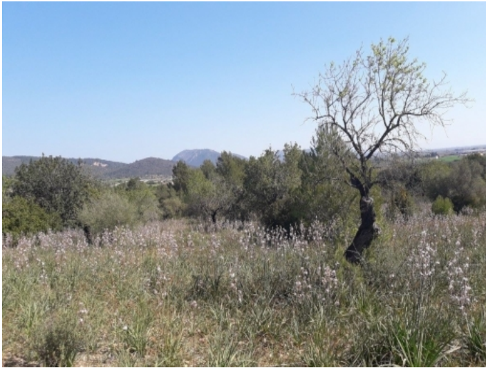
Leichte Hanglage erlaubt traumhaften Ausblick