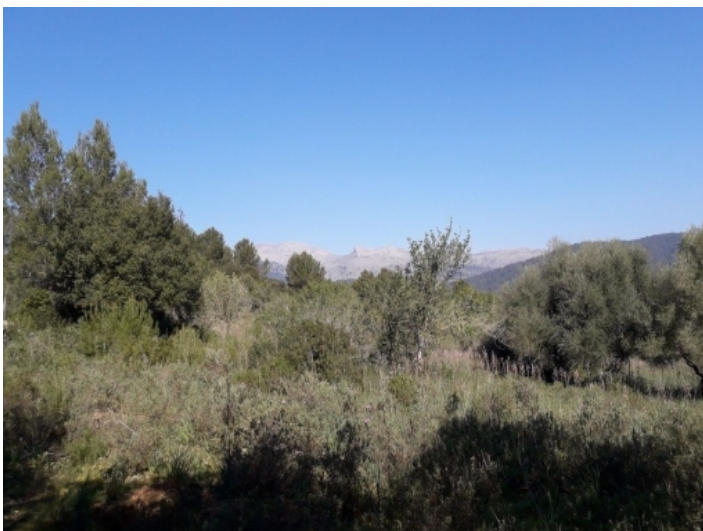
Schöner Ausblick auf die Tramuntana