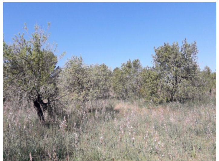
Eine zweistöckige Finca ist möglich