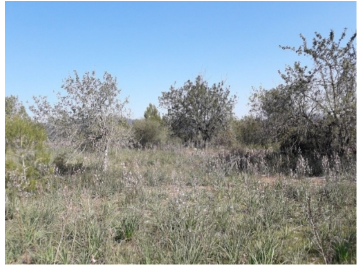
Großzügiges Grundstück von 43.000 qm