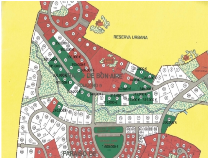
20210313 Mapa con precios