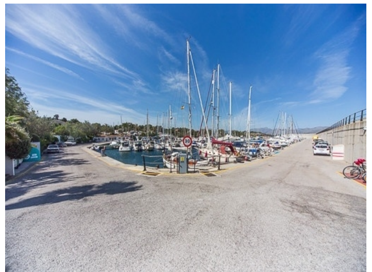
Nahegelegener Hafen von Bonaire

PORTA MALLORQUINA • C./ COLOM 20 2º, 07001 PALMA, SPANIEN