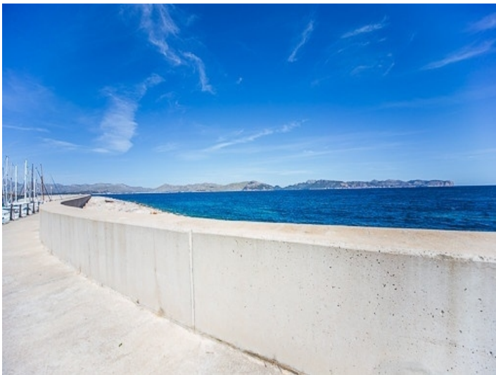
Ganz in der Nähe liegt der Hafen