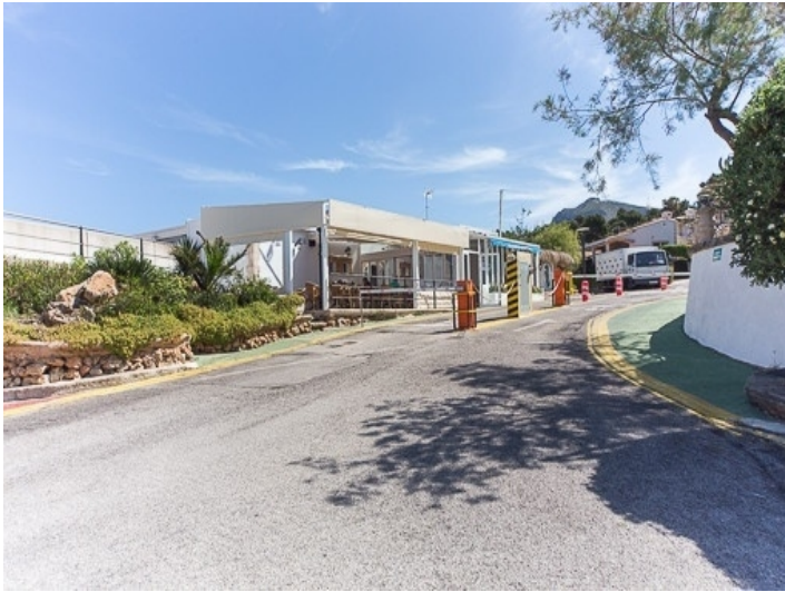
Zugang zur Urbanisation