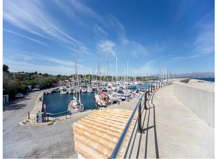
Der bekannte Hafen Cocodrilo in der weiteren Umgebung