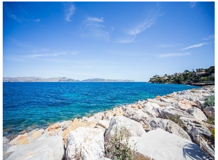
Die Bucht von Pollença