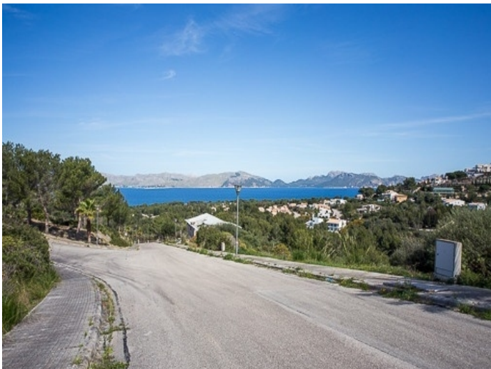
Meerblick von Grundstücken in Hanglage