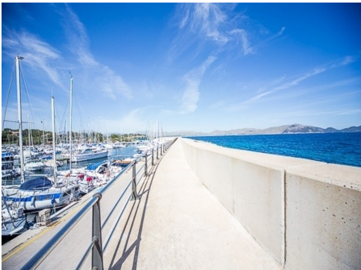
Hafen von Bonaire