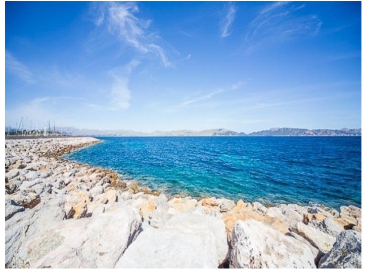
Das Meer liegt nur 1 Autominute entfernt