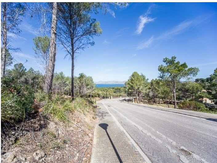
Mehrer zusammenhängende Grundstücke können erworben werden