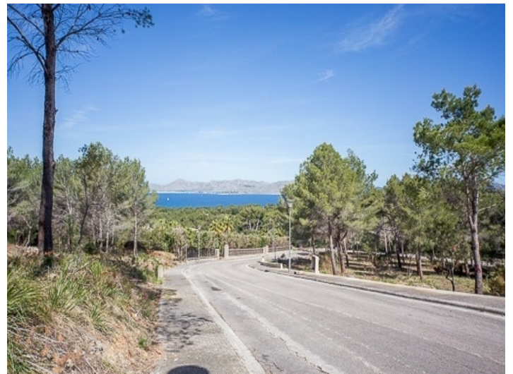
Perfekt ausgebaute Infrastruktur