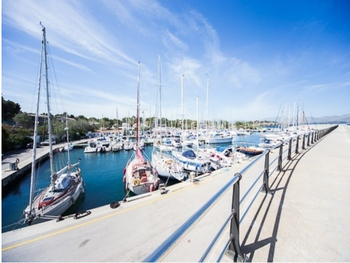
Der Sporthafen von Bonaire liegt 1 Autominute entfernt