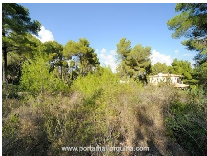
Plot without project