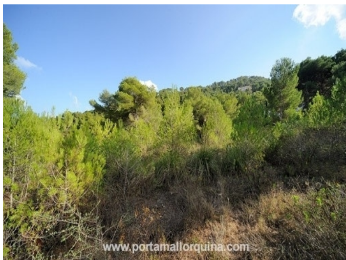
View of the surrounding