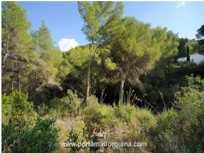
Plot in Canyamel