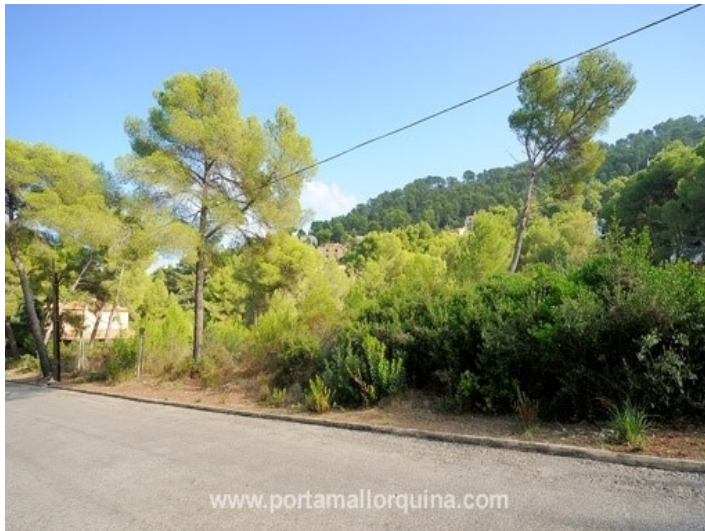
Views from the street