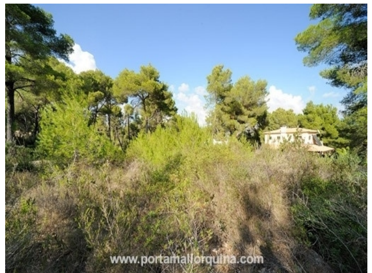
Plot without project