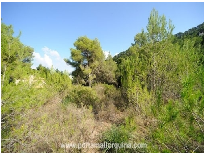
Plot of 683 sqm