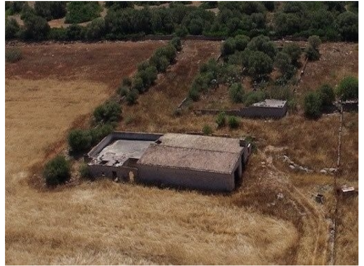
Kleines Haus auf dem Grundstück