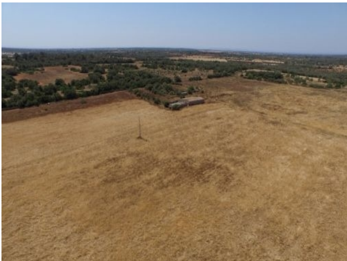
Beeindruckender Blick auf das Grundstück