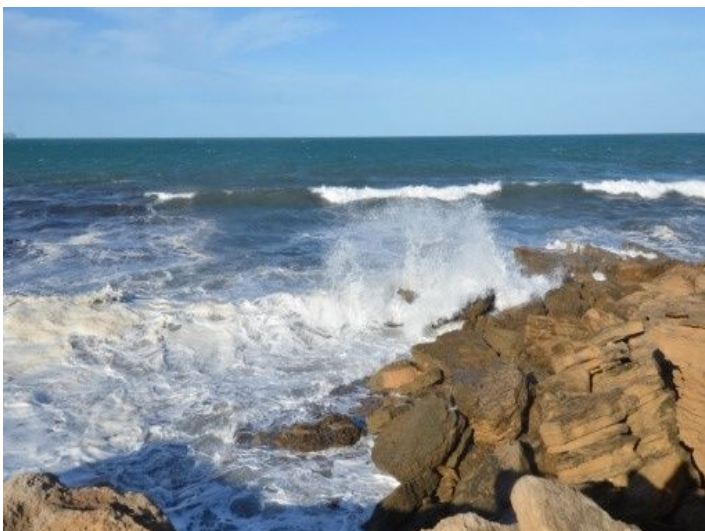
In unmittelbarer Meeresnähe