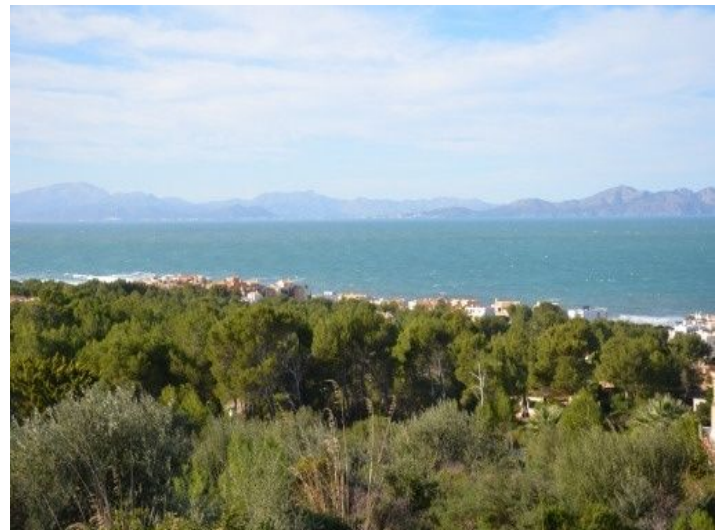
Blick aufs Meer