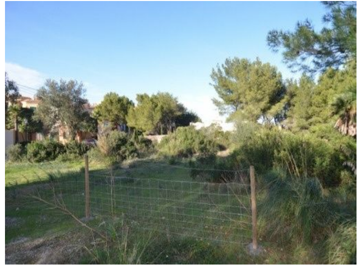
Großzügiges Grundstück mit 740 qm