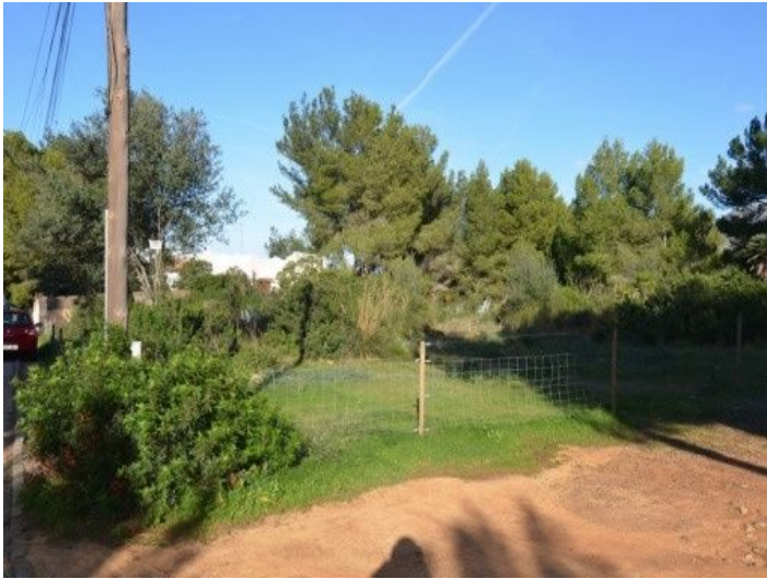
Grundstück in einer Urbanisation