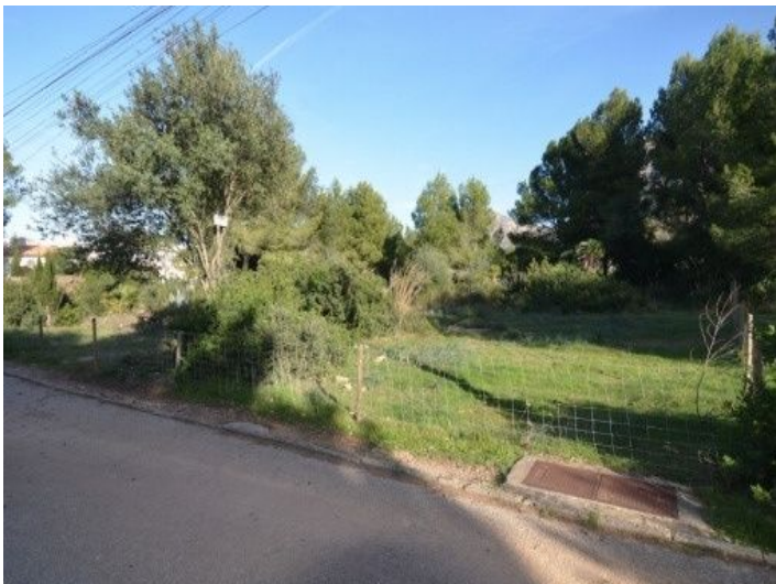
Blick von der Straße