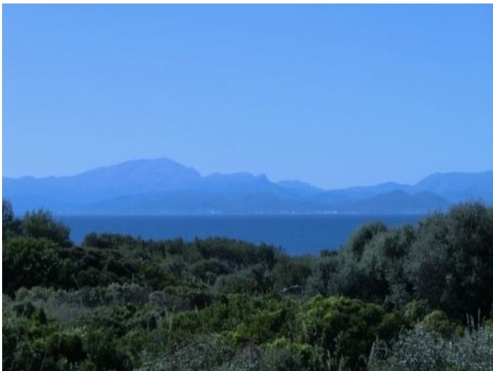
Blick auf die Bucht von Alcudia