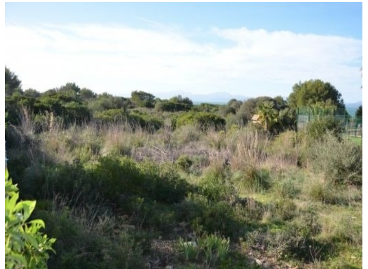
Grundstück mit 818 qm