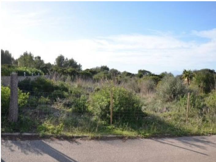
Straßenansicht des Grundstücks