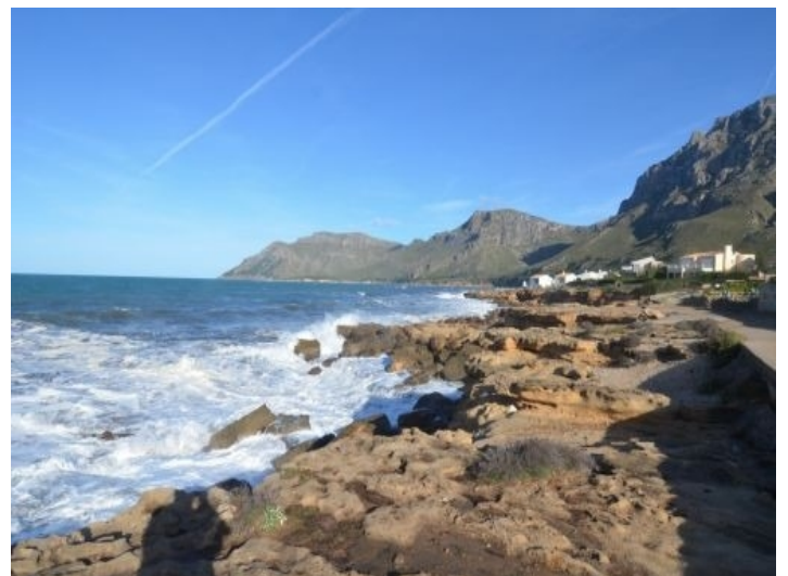
Blick auf die Küste