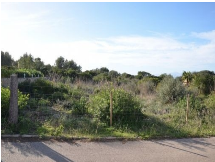
Grundstück in zweiter Meereslinie