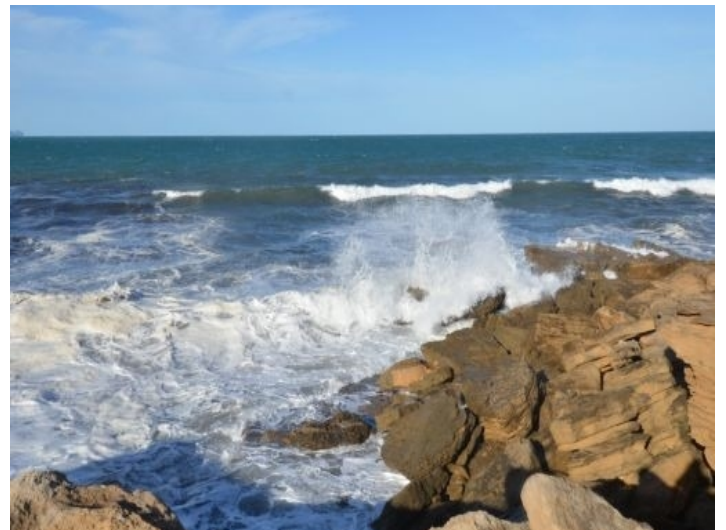
Grundstück in Meeresnähe