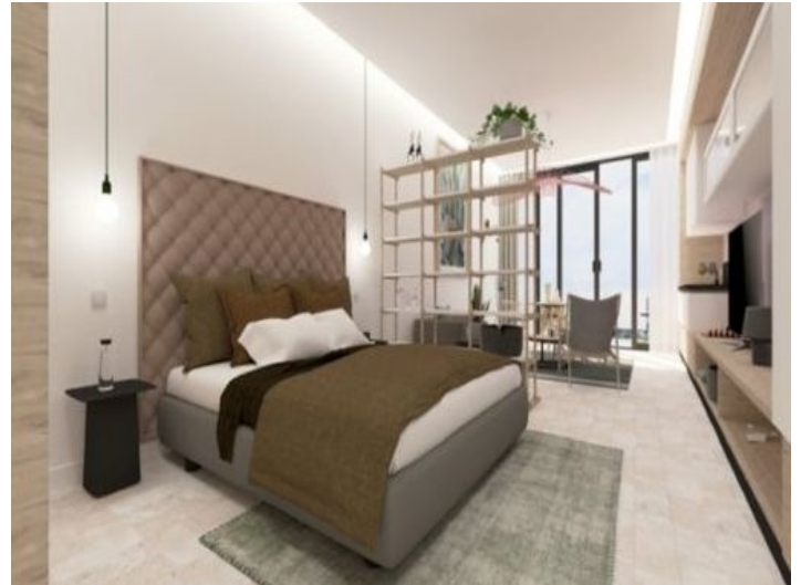
Mögliche Ansicht eines Schlafzimmers