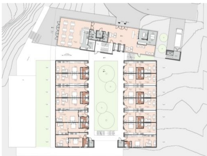
Grundriss des Projekts