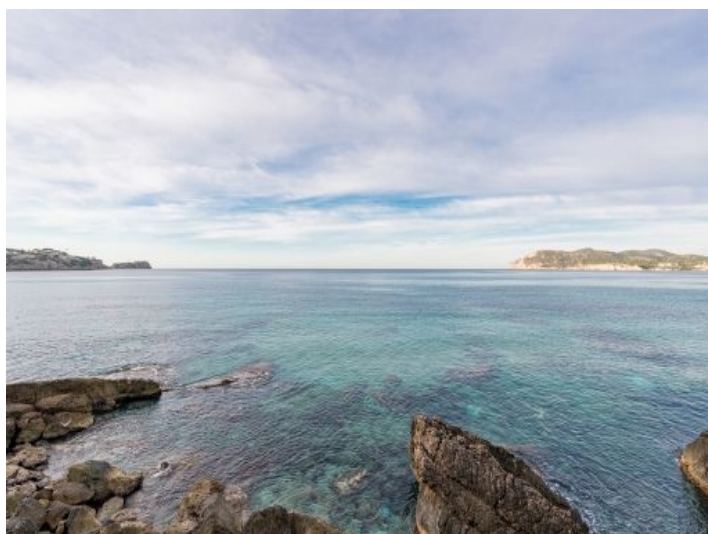
Ansicht der Costa de la Calma