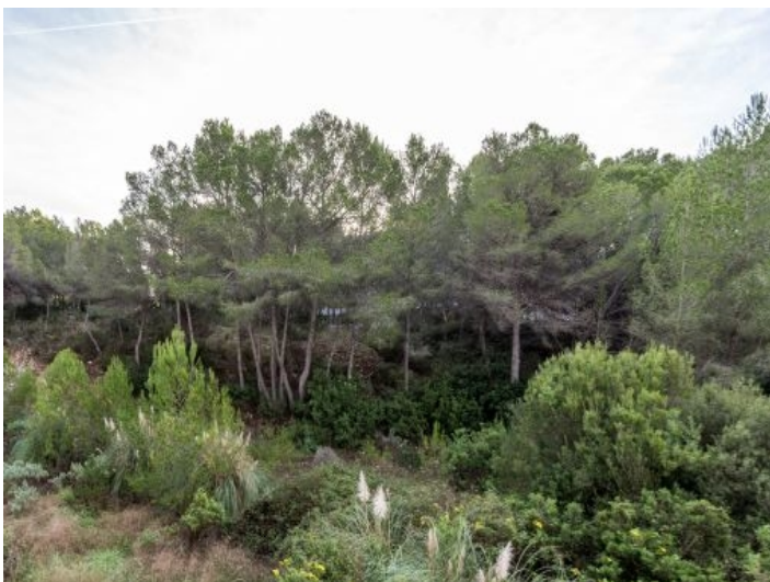
Alternative Ansicht des Grundstücks