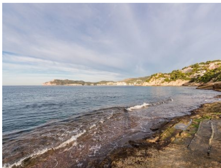
Ansicht der Costa de la Calma