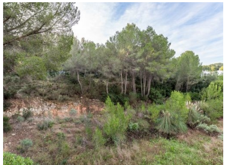
Alternative Ansicht des Grundstücks