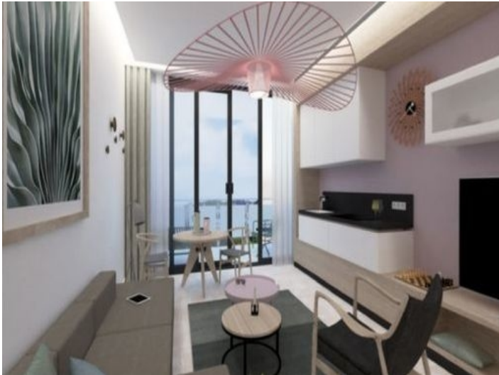
Mögliche Ansicht eines Wohnbereichs