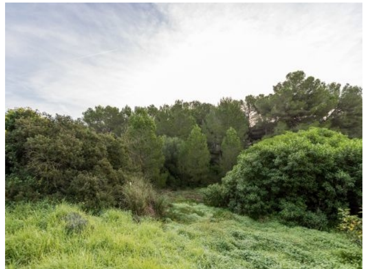
Alternative Ansicht des Grundstücks