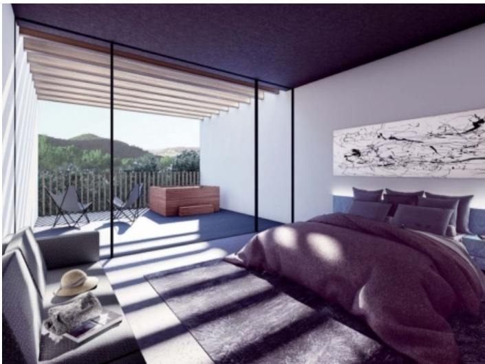
Panorama Fenster im Schlafzimmer