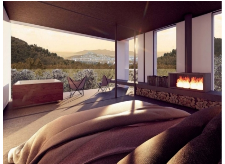
Schlafzimmer mit Blick über Dalt Vila