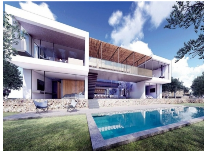
Außenansicht und Poolbereich der Villa