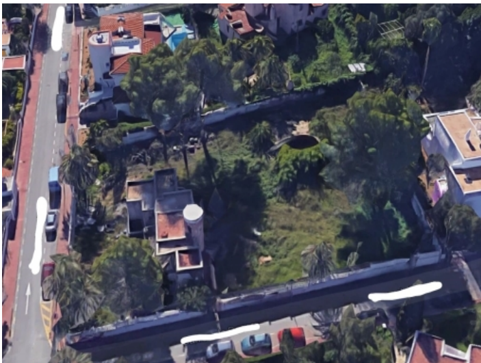
Das Grundstück aus der Vogelperspektive