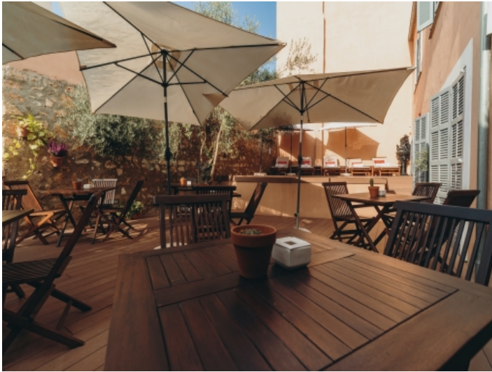
Terrasse mit Sitzbereich