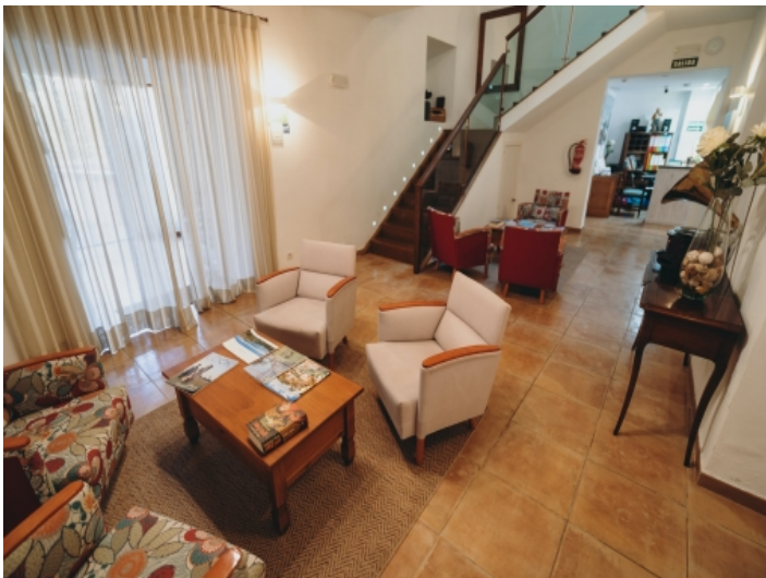
Eingangsbereich und Rezeption