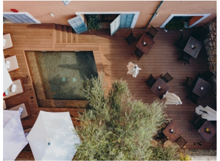
Terrasse mit Pool und Essbereich