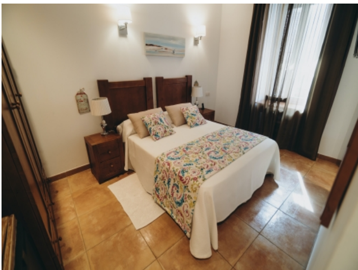
Eines von 8 Doppelzimmern