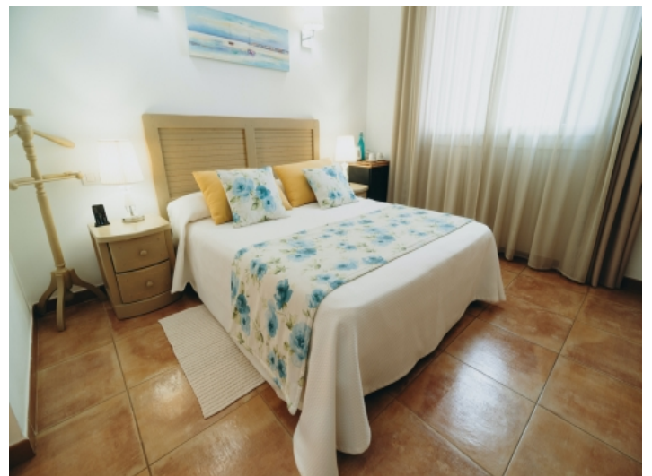
Eines von 8 Doppelzimmern