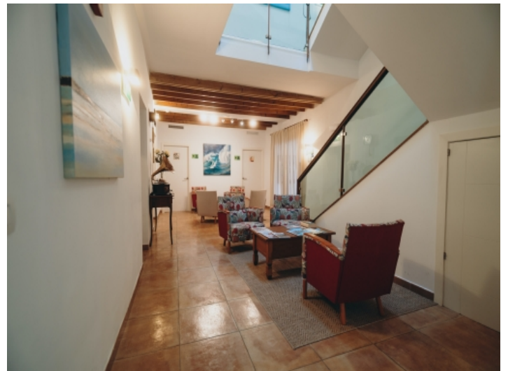
Eingang und Empfangsbereich