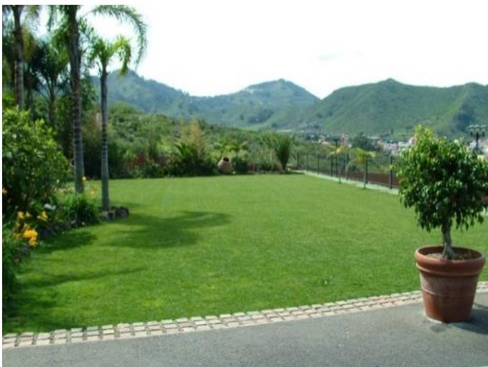
Spacious outdoor area with green space