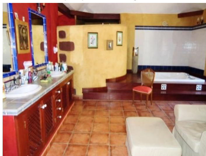
Large bathroom with an impressive Jacuzzi