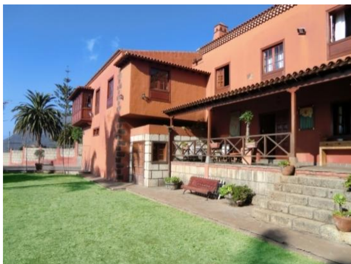
Stately Home with covered Terrace