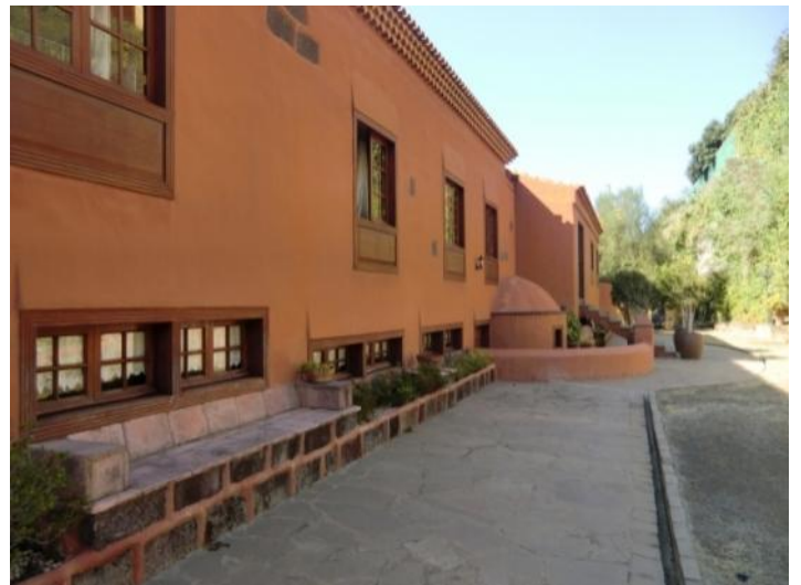
Stylishly designed path with polygonal slabs