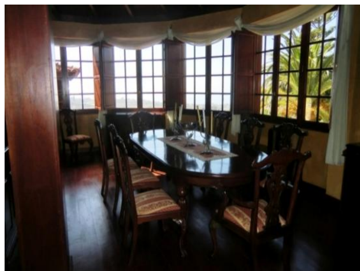
Dining area with beautifully designed windows with wooden frames