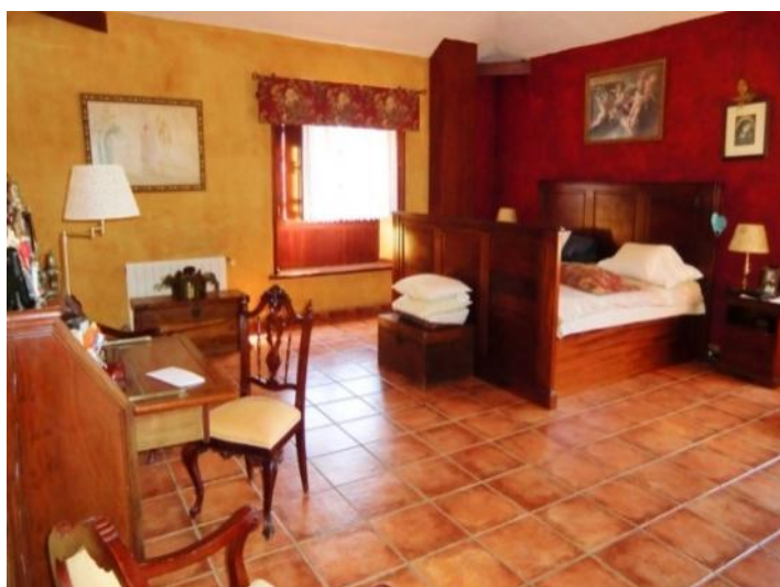
Spacious bedroom with double bed