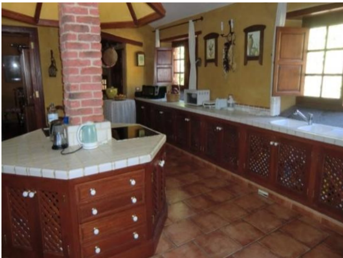
Spacious kitchen with cooking island and white tiled worktop