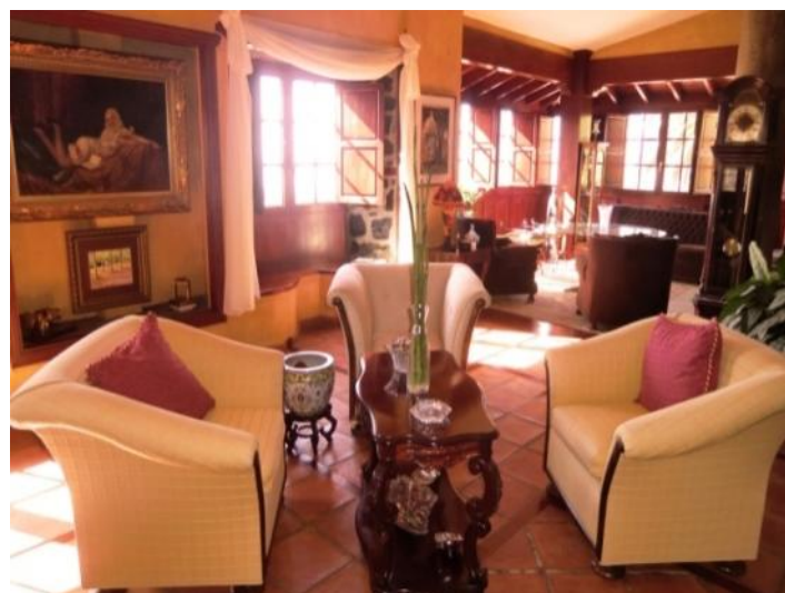
Stylishly furnished living area