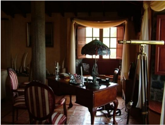
Traditional Canarian study