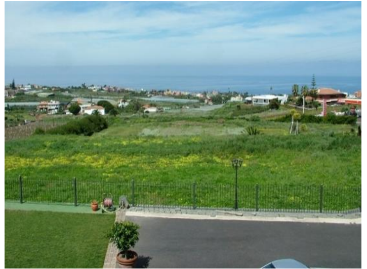
Impressive view of the sea