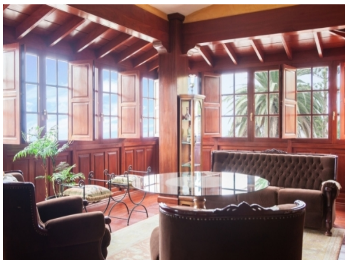
BALCONADA MADERA SALON SOCORRO-CARLOS