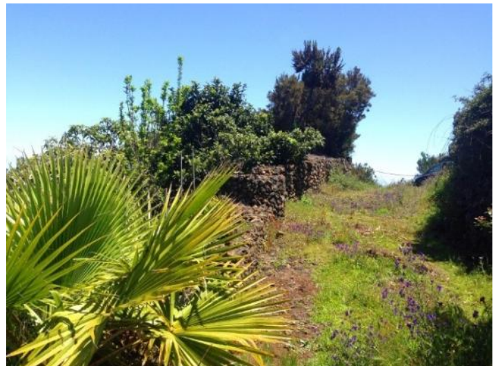
Fruit trees in the garden