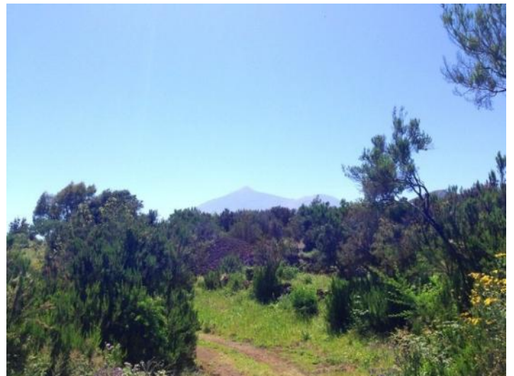
The small road