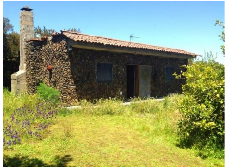
Another photo of the finca