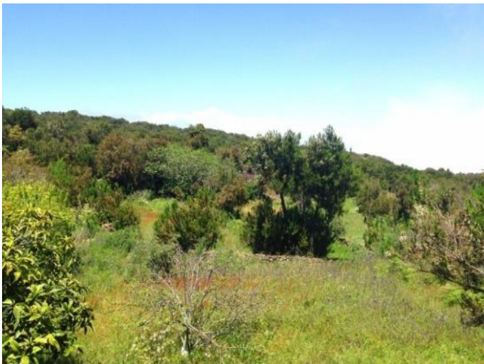
The rural garden