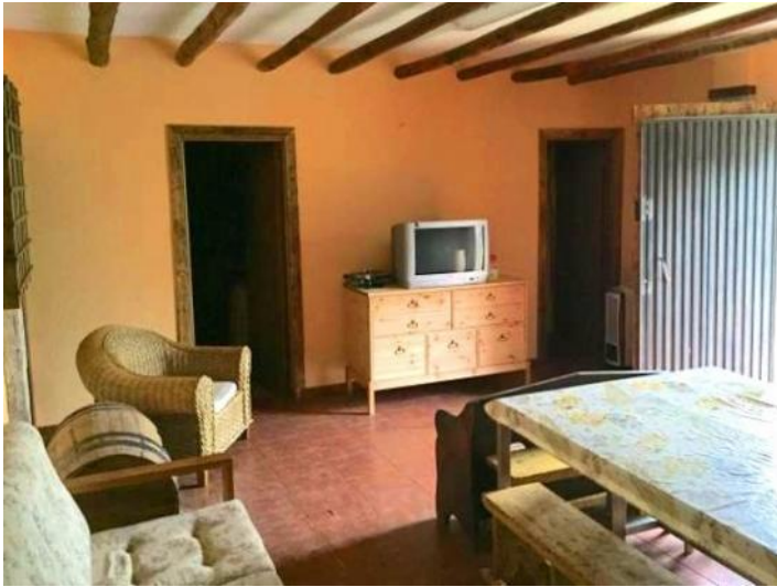
The living room