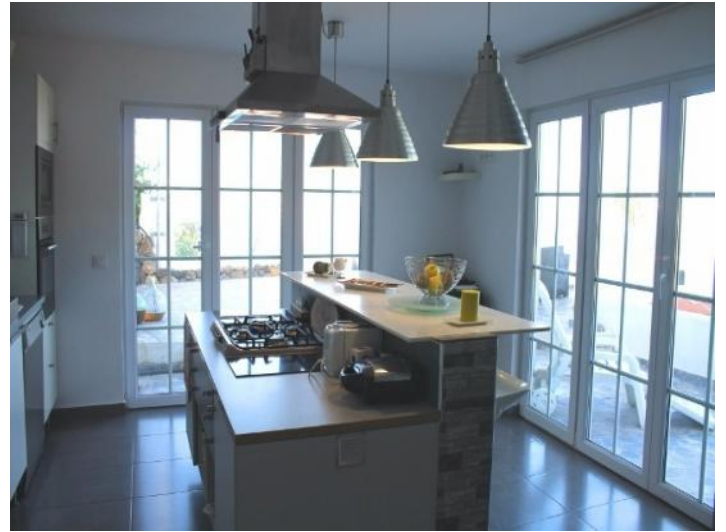
Modern kitchen with cooking island