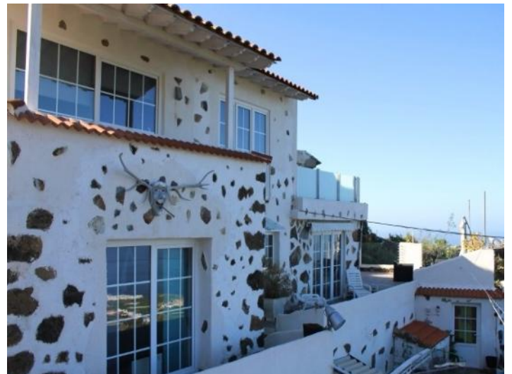
The house from the outside