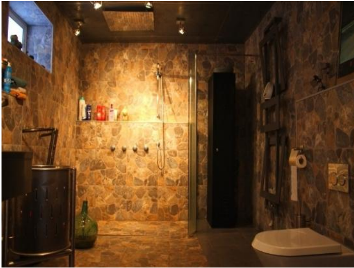
The fantastic bathroom with rainforest shower