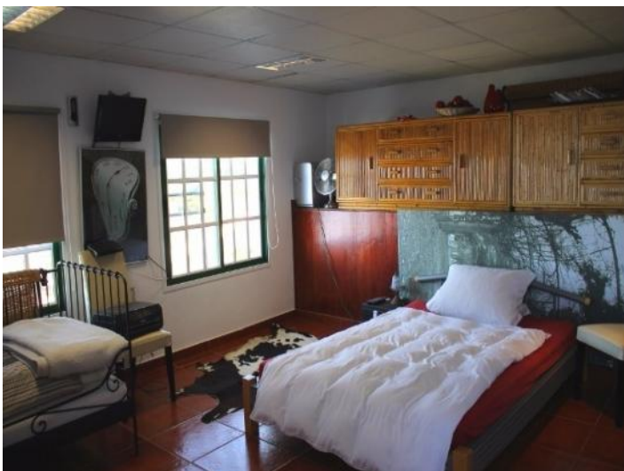
The guest apartment