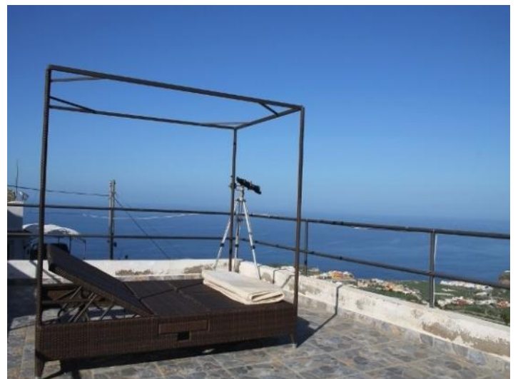
Terrace with sunbathing chairs and telescope