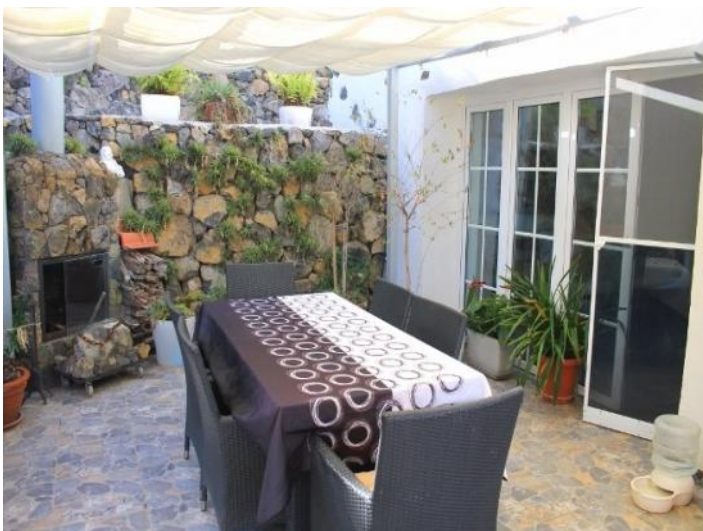
The terrace accessible from the living room