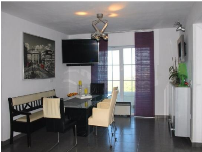
The spacious living room